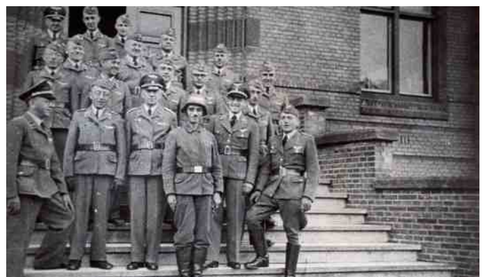
Duitsers op Stapelen