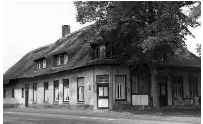
Halse Barrière in 1959 opgeofferd voor de A2.

In de 18e eeuw zijn er nog weinig verharde wegen in de republiek. De meeste wegen zijn van zeer slechte kwaliteit en delen van het jaar totaal onbruikbaar. Veel wegen liggen te laag, waardoor ze bij betrekkelijk weinig wateroverlast al niet meer bruikbaar zijn. Bij grotere overstromingen spoelen hele weggedelen en zelfs bruggen weg. Reizen is in die tijd derhalve een hachelijke onderneming. Men loopt ook het gevaar overvallen te worden door allerlei rondzwervend gespuis.