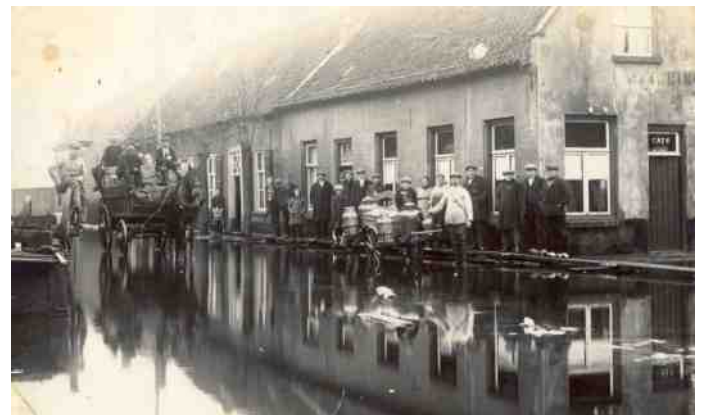
Wateroverlast op de Fellenoord begin 20e eeuw

Nederland kent veel waterwegen en het reizen per trekschuit is populair en comfortabel. Nieuwe wegen worden eigenlijk alleen aangelegd als er, voornamelijk militaire, noodzaak is. De aanleg van nieuwe wegen is relatief duur gezien de bodemgesteldheid, en de grondstoffen als keien en grint moeten uit het buitenland komen. De huidige provincie Noord-Brabant is in die tijd nog Staats-Brabant, waardoor weinig in infrastructuur geïnvesteerd wordt.