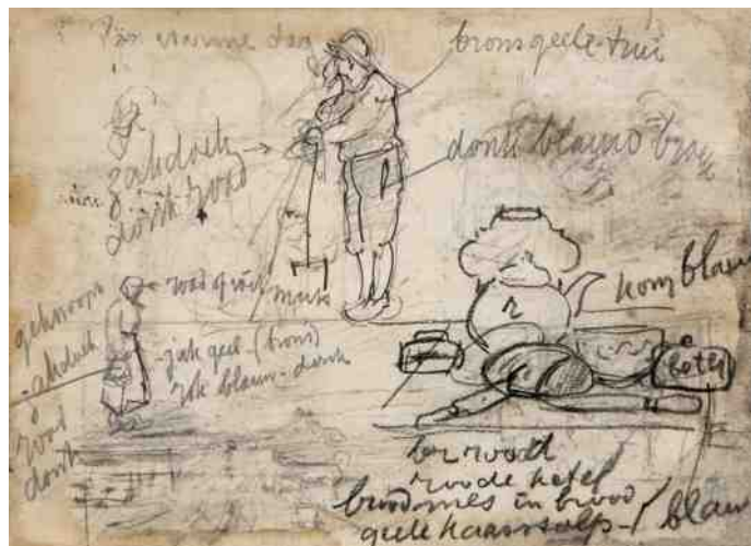
uit het schetsboek van Pierre Janssen

Op zondag 20 september om 11.15 uur houdt Christ van Eekelen in het MUBO een lezing over het werk en leven van de Boxtelse kunstschilder Pierre Janssen. Na een korte pauze leidt hij u ook rond door de lopende wisselexpositie van 60 schilderijen en 50 schetsen van Pierre Janssen. Entree: €3,50 Graag aanmelden op www.muboboxtel.nl of telefonisch op 06-16041898. De expositie duurt nog t/m 11 oktober. Het MUBO is geopend op zaterdag - zondag van 11.00 tot 17.00 uur