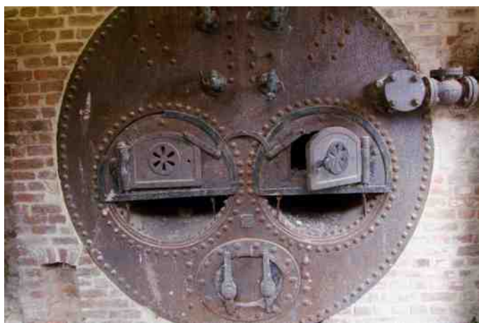
oude stoomketel brouwerij in Wilderen