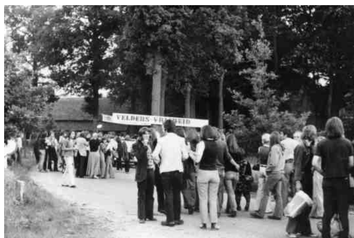
Protest in de jaren '70