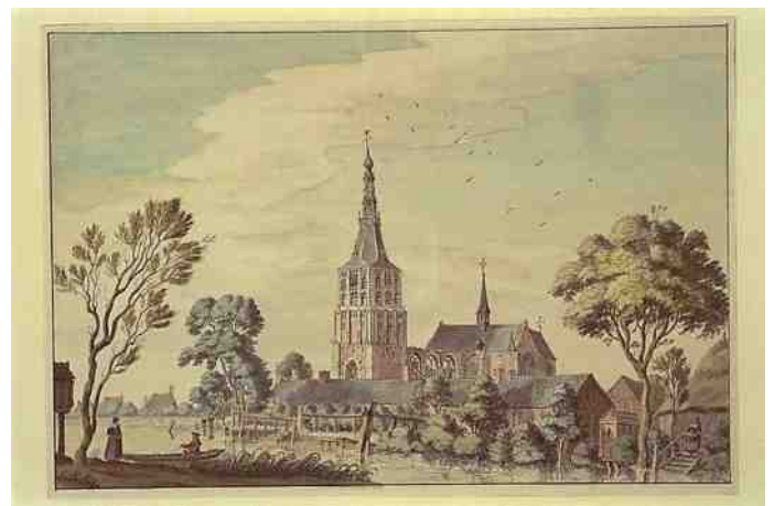
Op de voorgrond de gebouwen van het voormalige Clarissenklooster. In 1717 verlieten de zusters Boxtel