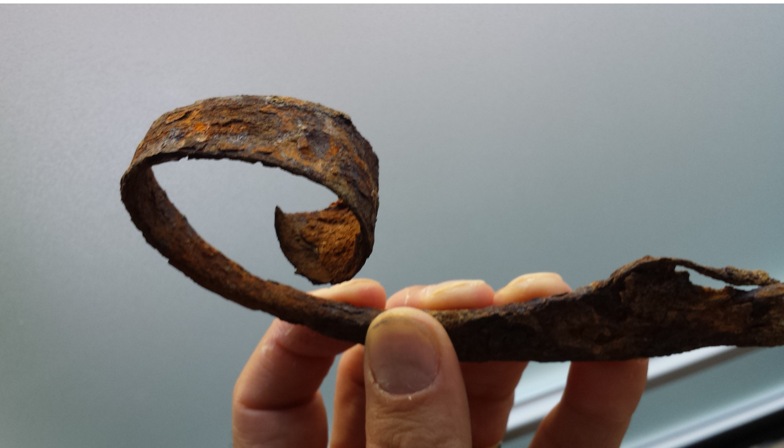
Detail van het schaatsijzer