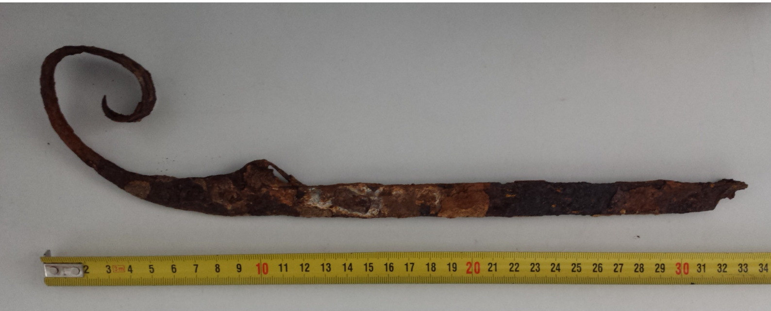
Een 'stuk oud roest' dat een schaatsijzer blijkt te zijn. 400 jaar oud. Gevonden in 2010 op de plaats van het afgebrande café de Kom