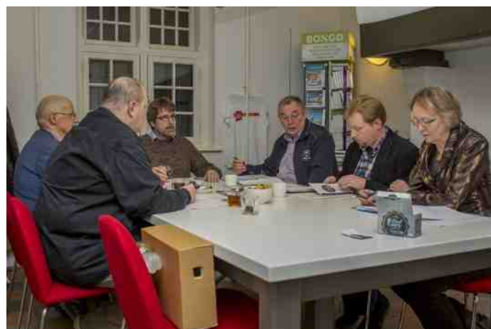
De eerste vergadering in de huiskamer van de VVV op 23 november 2016.

Heemkunde Boxtel trekt in bij VVV. Donderdagavond van 18:30 uur tot 20:30 uur en vrijdagmorgen van 10:00 tot 13:00 uur zijn Heemkundelieden te vinden in de 'huiskamer' van de VVV aan de Markt. Hier kan iedereen binnenlopen, die een vraag heeft over Boxtel. Het publiek kan ook binnenlopen als men foto's heeft van oud-Boxtel. Wij scannen ze graag in voor de Beeldbank. Het Heemkundebestuur houdt hier ook haar bestuursvergaderingen.