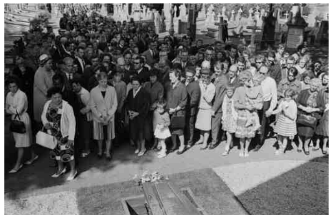
Drukke bij de begrafenis van bisschop Bekkers op 15 mei 1966 in St. Oedenrode