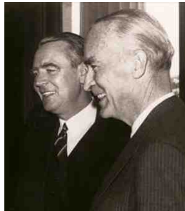
Alfried Krupp von Bohlen und Halbach en Berthold Beitz