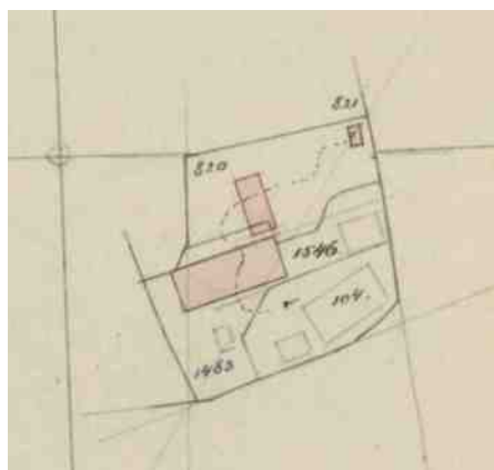
Kadastertekening Goorestraat 5 in 1883

Voor sommige boerderijen is zogenaamd dendrochronologisch onderzoek uitgevoerd. Dit houdt in dat er met behulp van jaarringen in het gebint is gekeken hoe lang geleden de boom gekapt is, welke voor het gebint gebruikt is. Ook is de bouwgeschiedenis van de boerderijen onderzocht. Vanaf 1832 is het kadaster beschikbaar, een schitterende bron voor deze gegevens. Daarom is de periode vanaf 1832 gemakkelijker te onderzoeken. In de periode daarvoor werden (ver)bouwingen niet of slechts sporadisch beschreven.