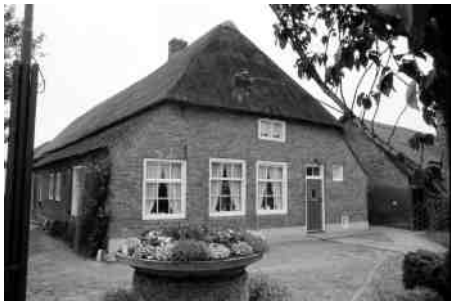
Goorestraat 5 in 1980

Medio november verscheen het boek Het steenen huijs met gebinte, stal ende schuren – Historisch onderzoek naar boerderijen in Boxtel, Lennisheuvel en Liempde .