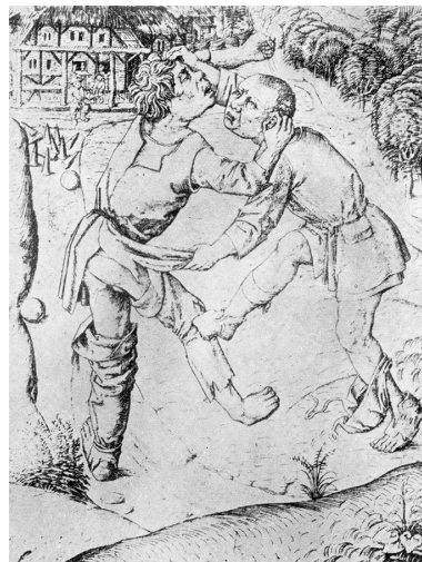
Gevecht tussen twee mannen