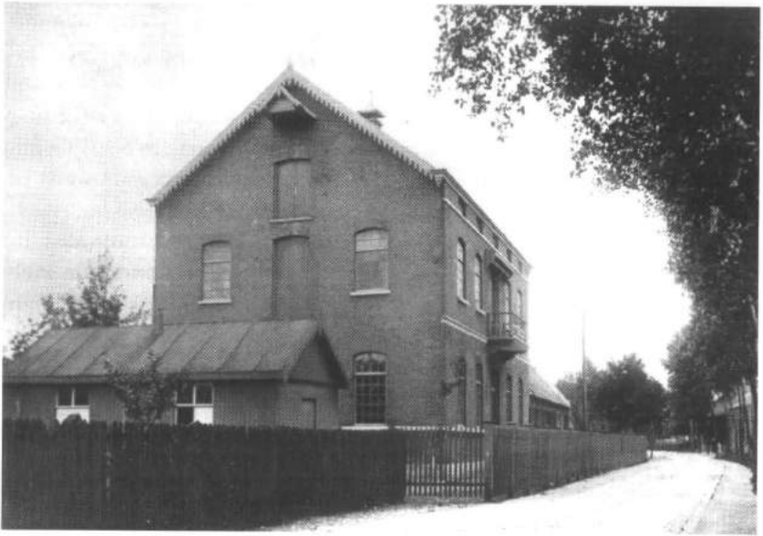
Afb. 2. Deze foto van het hoofdgebouw, opgetrokken in 1867, dateert van ongeveer 1900. In de nok van de zijgevel de katrol, waarmee de gebleekte en gewassen stukken naar de droogzolder werden gehesen.