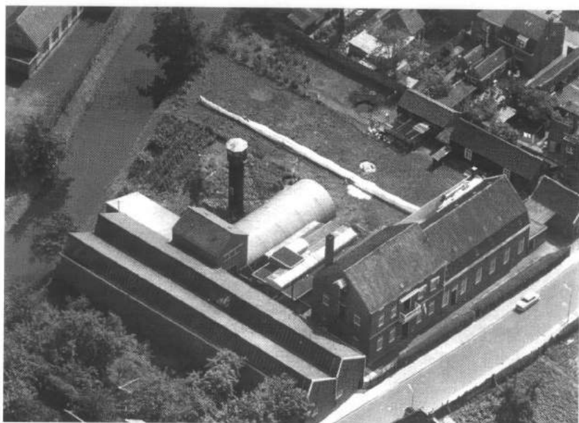
Afb. 4. De fabriek van Van Hoogerwou in 1959. Op de voorgrond (met sheddaken) de mechanische weverij. Aan het hoofdgebouw de in 1904 gebouwde fabriekshal. Duidelijk zichtbaar het op paaltjes gespannen linnen, dat te bleken hangt.

maken associeerde Van Hoogerwou zich in 1969 met de firma De Lange & Jonker te Vriezenveen. Dit bedrijf was geen weverij, maar een atelier met hetzelfde marktsegment als Van Hoogerwou. Door samenvoeging en concentratie van afdelingen in beide bedrijven trachtte men de rentabiliteit te vergroten. De Boxtelse weverij leverde damasten tafeloed aan De Lange & Jonker. 57 Het mocht allemaal niet baten. In 1970 was Van Hoogerwou net als zovele andere weverijen in Nederland gedwongen de poorten te sluiten. De directie realiseerde de bedrijfsbeëindiging met voldoening van alle crediteuren en vond voor alle medewerkers een passende werkkring. De Lange & Jonker nam de klanten, vertegenwoordigers en het verkoopnetwerk over. 58