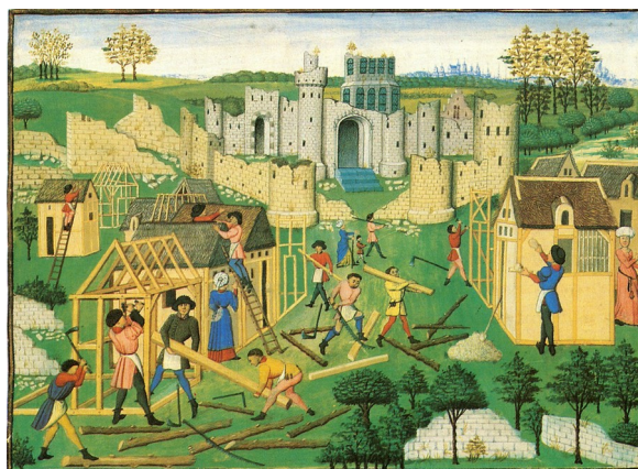
Het bouwen van huizen in de middeleeuwen. Links wordt het raamwerk van een huis uitgebeeld; daarachter zijn rietdekkers bezig. Rechts is een man bezig met het met leem besmeren van het vlechtwerk

Het dagelijks leven op het platteland in de winter. De muren bestaan uit vakwerk. Dat bestaat uit een houten geraamte dat, in vakken verdeeld, met vlechtwerk van takken was opgevuld, waarover leem werd gestreken. In het huis zijn woon- en stalgedeelten samengebracht.