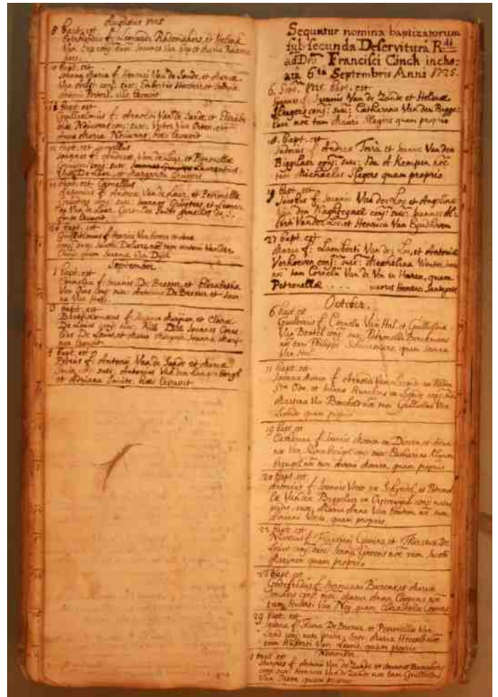
Doopboek van de RK kerk Sint Petrus van het jaar 1752.

Omdat onderzoek van de jongste generaties lastig is, houdt hij zich aanbevolen om deze gegevens te krijgen.