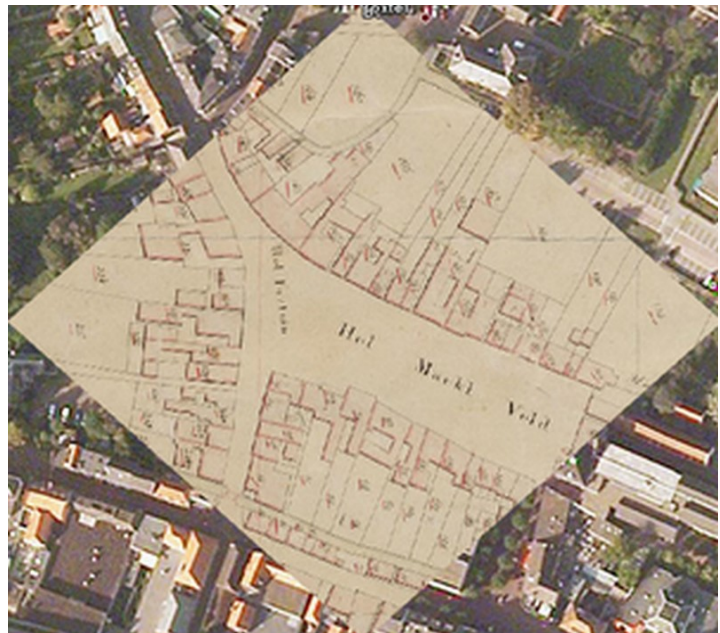
Foto: kaart 1832 over de Markt in 2006

De kadastrale kaarten van 1832, niet alleen van Boxtel, maar van heel Nederland staan op www.dewoonomgeving.nl .