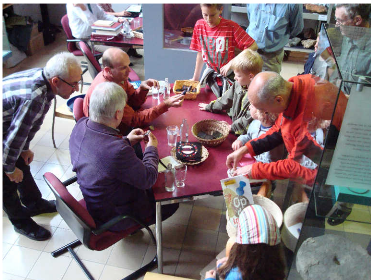
Determinatiedag van archeologische vondsten in het Oertijdmuseum