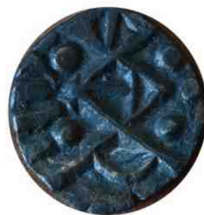
Denarius, munt gevonden in de Clarissenstraat