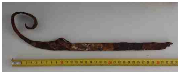
Het stuk 'oud roest' blijkt een schaats uit de 17e eeuw.

De schaats werd van 14 december 2016 tot 7 januari 2017 geëxposeerd in de bibliotheek aan de Burgakker, tegelijk met "Boxtel on ice" bij de Zwaanse brug, dat georganiseerd werd door 'Meneer van Dommen'.