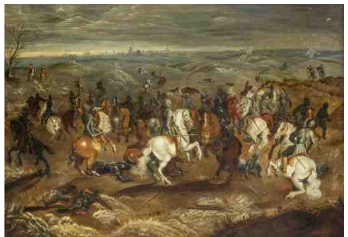
Lezing Slag van Leckerbeetje februari 2016.