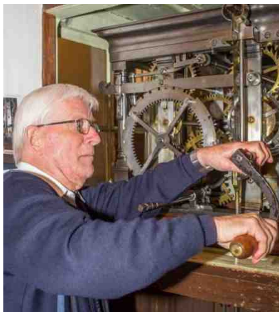
De klok van het Kapucijnenklooster te Velp.

In oktober werd een 'archeoloop' georganiseerd en werd aandacht geschonken aan de 'week van de geschiedenis'