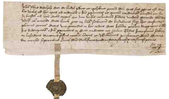
Werkgroep Clarissen met een charter gedateerd 10 september 1467.