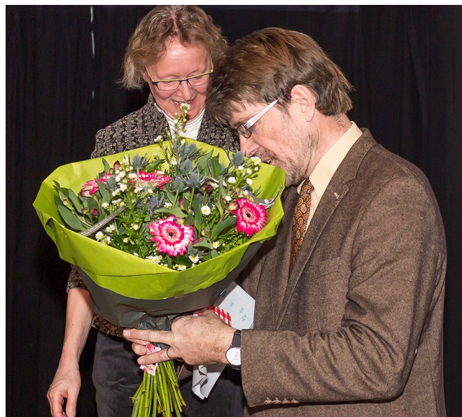
Er is wat klimwerk voor nodig om op niveau afscheid te kunnen nemen