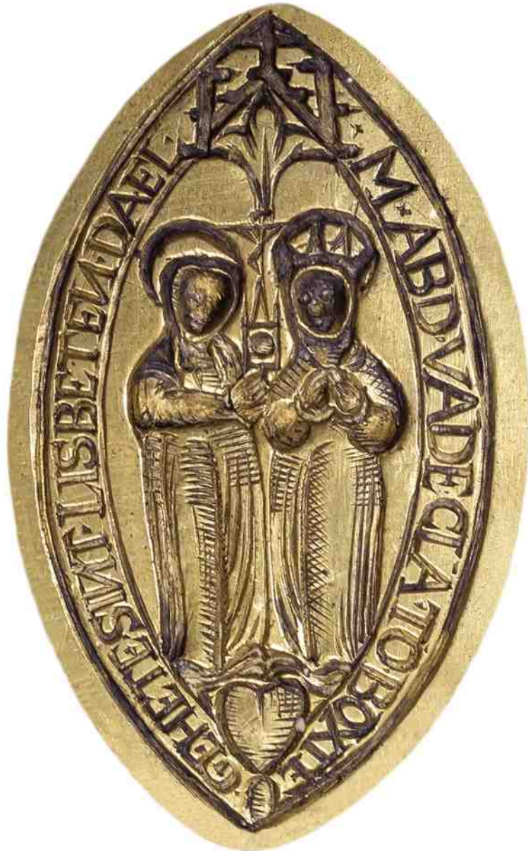
lakzegelstempel Clarissenklooster St.-Elisabethsdael Boxtel