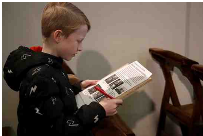
Sommige opdrachten zijn best wel moeilijk

Na de 'plattegrond-oefening' startte de speurtocht. Er moesten 6 locaties gevonden worden die overeenkwamen met de afbeeldingen op het zoekblad. De plaatsen moesten daarna precies worden aangegeven op de plattegrond van de basiliek