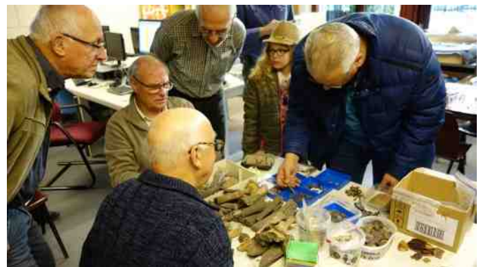
Het determineren van gevonden botten op de Markt

En we zullen zelfs stil staan bij toekomstige archeologische onderzoeken. Onder meer bij “Heem van Selis” en een grensverleggend onderzoek in het centrum met de codenaam CARE.