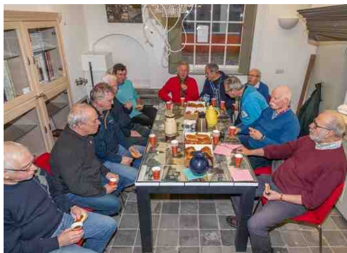
De catering zorgt goed voor de sjouwers van het archief

- We hebben intussen een bijdrage geleverd aan een brochure over de nieuwbouwwijk Heem van Selis, die waarschijnlijk in april 2019 zal verschijnen. Onze werkgroep archeologie probeert hier zoveel mogelijk bij betrokken te zijn en we proberen onderzoeken ook op onze website te plaatsen