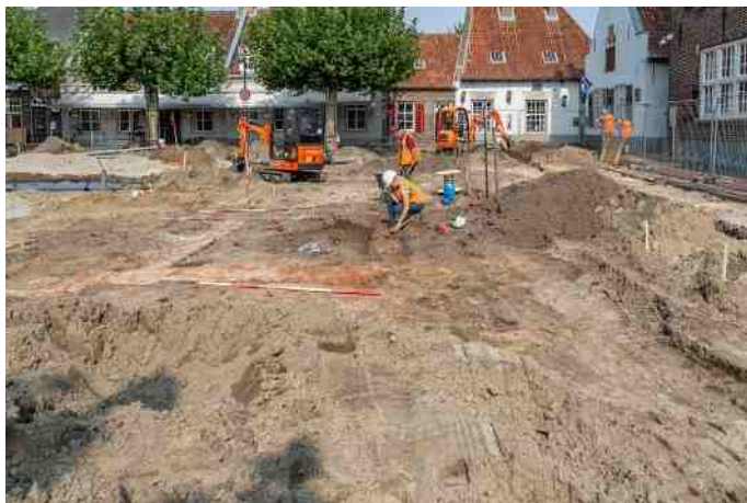
Op de Markt worden de fundamente van het vorige gemeentehuis ontdekt

Archeologie bestudeert het werken en wonen van mensen in het verleden. In deze lezing krijgt u beelden te zien over de recentste vondsten uit onze gemeente. Zo hebben vrijwilligers van de Heemkunde in 2018 zand afkomstig van de Markt doorzocht. De meer dan 1000 gevonden voorwerpen worden nu gedetermineerd en waar mogelijk gedateerd. In verband hiermee komt het mysterieuze fundament bij Oliemeulen aan bod. Ook een naakt kindje Jezus, het verlies van muntgewichten en grote stenen knikkers komen hier aan bod.