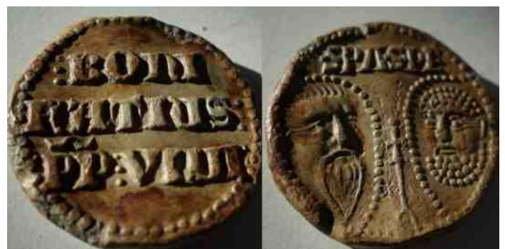
Bulla van paus Bonifatius de negende 1389-1404