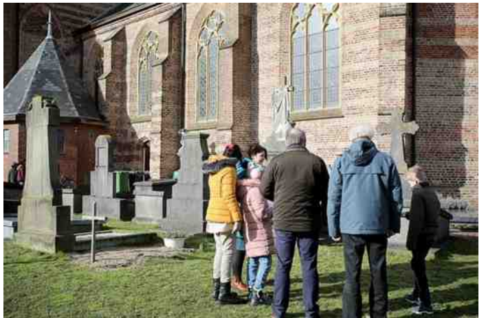
Ook de buitenkant werd geïnspecteerd

Het glas-in-loodwerk: was heel mooi - 49 grote glas in loodramen geteld – hele mooie kleuren – enkele zwakke plekjes in de hoeken. Het metselwerk buiten: verschillende kleuren stenen grijs en rood – grijze stenen brokkelen vooral af - bij ramen brokkelt steen af door vocht – stenen liggend gemetseld – restaureren van kapotte stenen. Wel knap gemaakt.