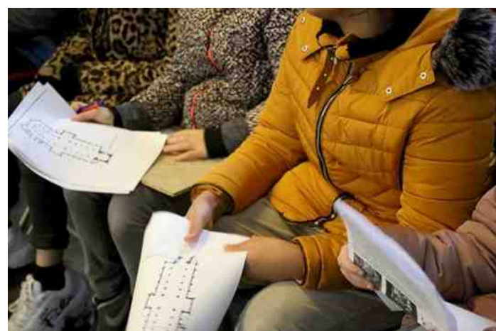
Het bestuderen van het grondplan van de basiliek