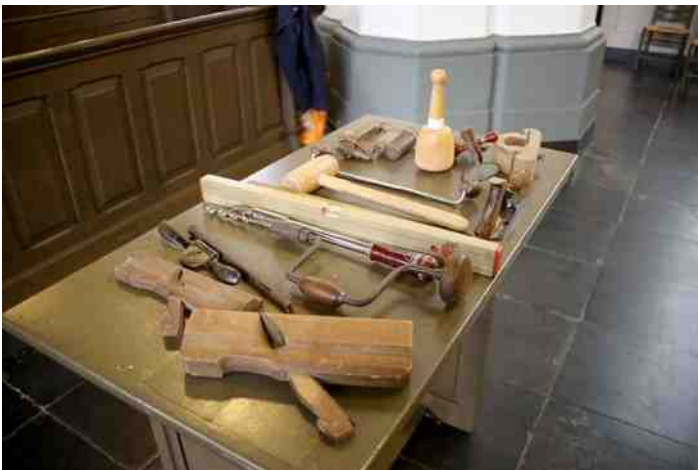
Het gereedschap van de timmerman

Daarna gingen de groepjes aan de slag met de inspectiekaarten om het timmer-, schilder-, hout-, metsel- en dakwerk te inspecteren aan de hand van een aantal vragen.