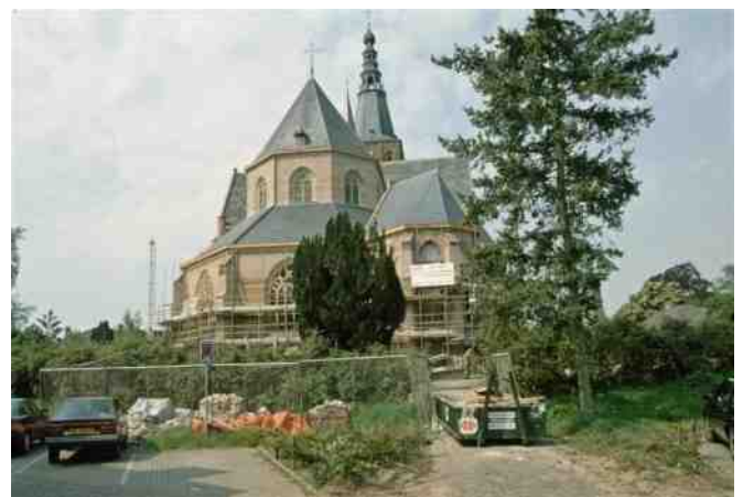
Boxtel, 1993: restauratie Sint-Petruskerk en herinrichting van het kerkhofterrein bieden kansen voor nader onderzoek van de intrigerende kerkheuvel.