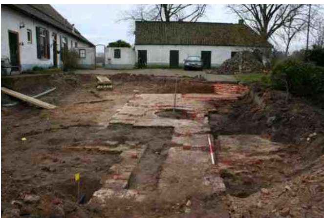
Sint-Michielsgestel, Oud-Herlaer, maart 2016: de heling van de 11 de -eeuwse motte toont de funderingsresten van de 14 de -eeuwse kasteelherbouw.

Historicus, voorzitter Vereniging Vrienden van Brabantse Kastelen