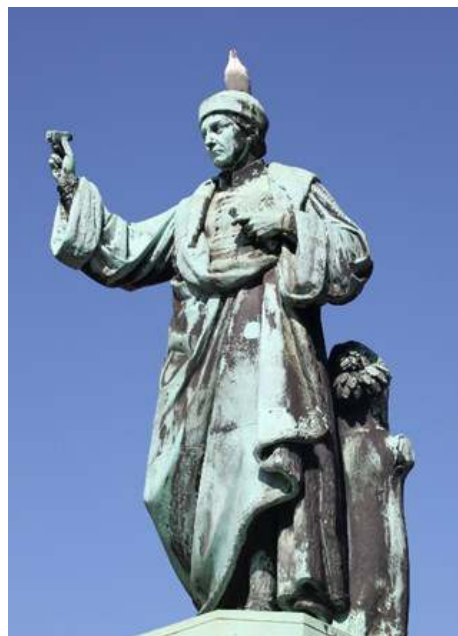
Laurens Janszoon Coster, Haarlem

'Zou Laurens Janszoon Coster de boekdrukkunst hebben uitgevonden, als hij had geweten hoe sommige kranten elke dag het nieuws verslaan?' (H.)