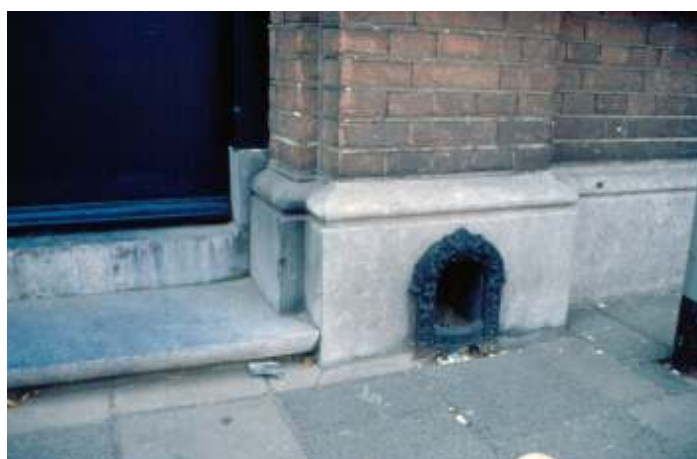
Oude Kerkstraat 9