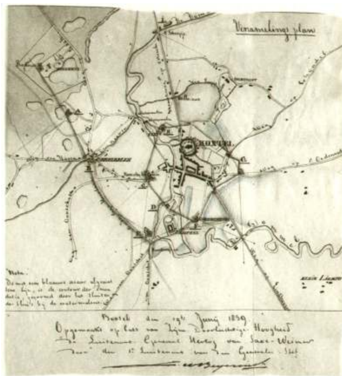
Kaartje van de luitenant Beijerinck met daarop alle Boxtelse redoutes

Kort voordat alle militairen Boxtel verlaten, maakt de 1 e luitenant Beijerinck van de Generale Staf op 19 september 1839 in opdracht van de luitenant-generaal de Hertog van Saksen-Weimar-Eisenach een – bewaard gebleven ( Stichting Menno van Coehoorn ) – kaartje van alle Boxtelse redoutes. Hierop zijn onder meer de schootsrichtingen ingetekend.