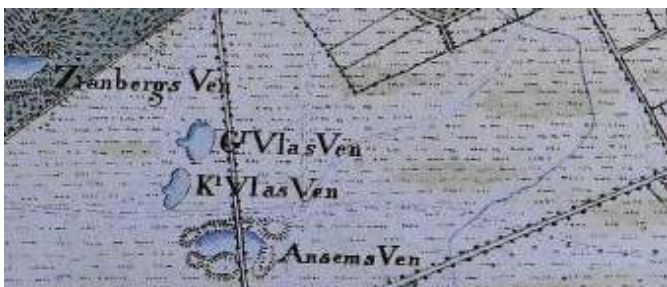
Vlasven, Groot en Klein HtANB ca. 1836-1843

Vermeldingen of attestaties met Groot en Klein Glasven: Gr[oot] Glas V[en], Kl[ein] Glas V[en] , 1838;