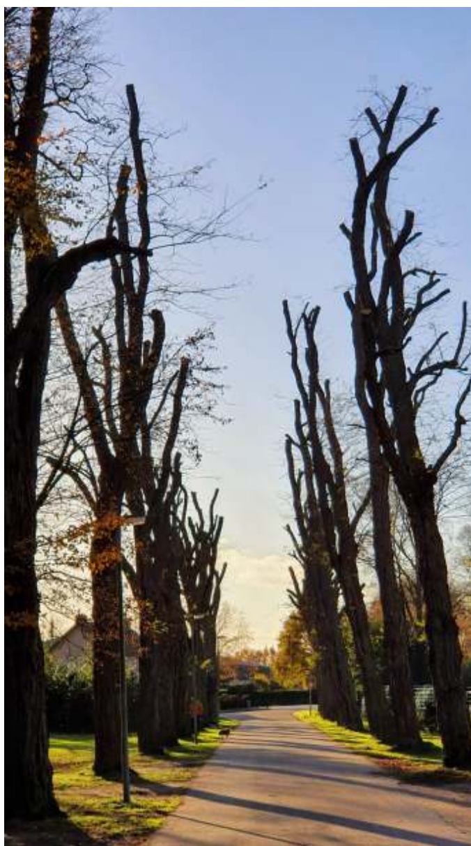
Platanenlaan anno 2021

Er is zelfs nooit een straatnaam naar onze vorige koningin Beatrix genoemd. Wel naar haar ouders en grootouders.