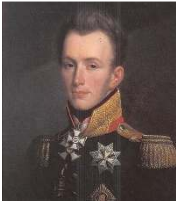
Kroonprins Willem, de latere koning Willem II in zijn jonge jaren

biedt plaats aan ruim 10.000 militairen, hun paarden en uitrusting. Anno 2021 zij daar nog sporen van terug te vinden in het terrein! Medio 2016 wordt aandacht – o.a. tentoonstelling en een boek – besteed aan Kamp Oirschot door heemkundekringen De Heerijkheid Oirschot , Den Beerschen Aard en De Hooge Dorpen . Ook Stichting Kapittel van Oirschot en Museum De Vier Quartieren doen mee. Momenteel besteedt Heemkring Molenheide (o.a. Rijden) aandacht aan het kamp bij Rijen.