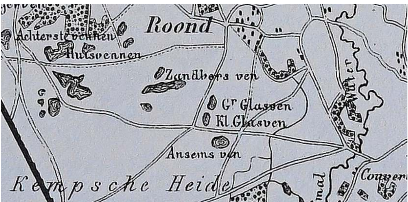
Glasven, Groot en Klein Kuyper 1865

Het bovenstaande laat onder meer zien hoe belangrijk het in de naamkunde is over oude(re) vormen van namen te beschikken. Deze vormen liggen immers dicht(er) bij het moment waarop de veldnamen of toponiemen zijn gegeven. Ze zijn daardoor betrouwbaarder voor een (mogelijke) verklaring van de namen.