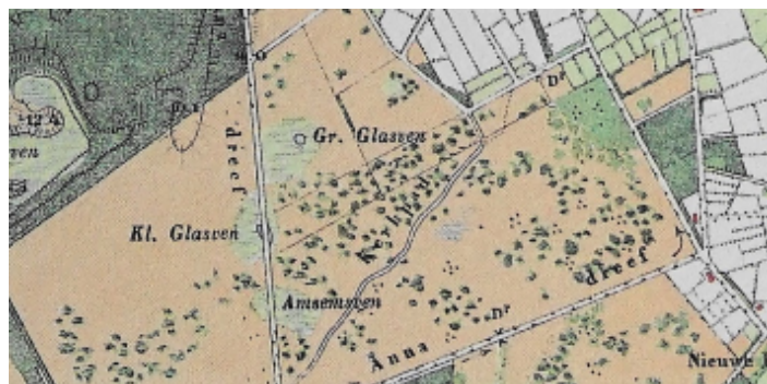
Glasven, Groot en Klein HANB 1867 en 1895

'Na het repelen (= het vlas ontdoen van de zaaddozen) schift men het vlas enigszins naar de lengte en bindt het, niet te vast, in kleine bossen en deze gaan groen in de 'rot'. Tot het 'rotten' (rooten) dient meestal een of andere sloot, bij voorkeur een, onder elzenhout gelegen, omdat elzenhout gezegd wordt gunstig te werken op de kleur van het vlas. Enkele malen komen rotkuilen voor en dikwijls brengen landbouwers hun vlas naar de als goed bekende rotplaats bij vrienden, als in hunne buurt geen of slecht water (bv. ijzerhoudend) is. Daar gewoonlijk de diepte der rotplaats onder water te gering is om het vlas regtop te zetten, wordt dit zoveel mogelijk schuins daarin gelegd, met den top naar bo-