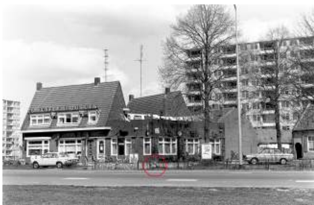
Brederodeweg met café Het Witte Paard. In de rode cirkel staat het paaltje dat hiernaast is afgebeeld.

Door de regering werd besloten tot verdubbeling van de rijstroken en tot verlegging van die weg te Boxtel in nog meer oostelijke richting. Daardoor was Boxtel-Oost dan wel vanaf 1967 bevrijd van het drukke doorgaand verkeer maar vanwege de gelijkvloerse kruisingen met stoplichten groeiden de autofiles op die 'autobaan' steeds meer. Om die autoweg Amsterdam-Maastricht', die uitgroeide