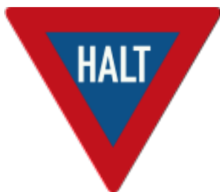
'Halt en let op het verkeer op den hoofdweg, dat voorrang heeft.'

Nu we het toch over voorrang hebben; dat werd vroeger op verschillende manieren aangeduid. Als voorrangskruising of voorrangsweg. Binnen of buiten de bebouwde kom. We hebben het vroeger allemaal