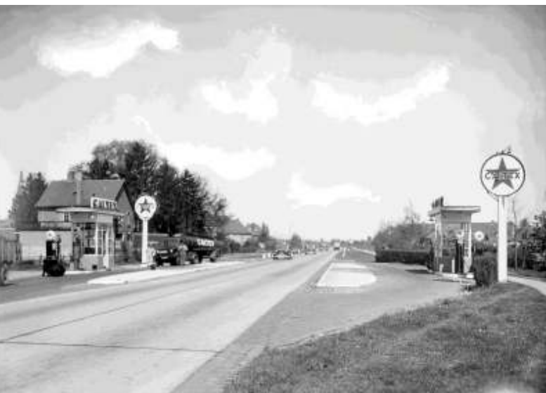
Rijksweg 264, de huidige Brederodeweg, met de benzinepomp van Looijmans. De pomp links staat ter hoogte waar nu de parkeerplaats van Lidl zich bevind

bespraken de gemeenteraadsleden met ambtenaren van het ministerie begin jaren zestig het groeiend verkeersprobleem in Boxtel-Oost. Enerzijds was in de periode 1955-1967 de intensiteit van het gemotoriseerd verkeer over die Boxtelse weg toegenomen van ongeveer 12.500 tot ongeveer 24.000 voertuigen per dag, anderzijds verrezen er steeds meer woningen in de oostelijke woonwijk van Boxtel aan de andere kant van die 'Nieuwe Weg', officieel Rijksweg 264 geheten. Feitelijk liep toen die 'autoweg' door de bebouwde kom van Boxtel.