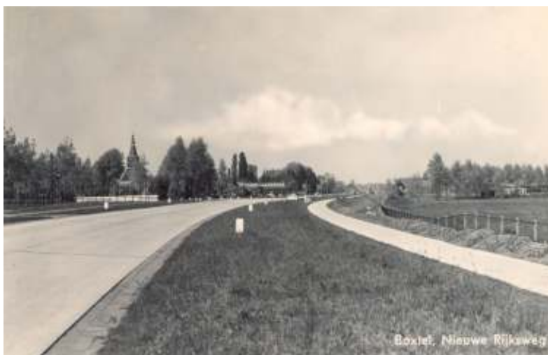
Boxtel, Nieuwe Rijksweg

De doorgaande route Amsterdam-Maastricht, waar de Boxtelse 'Nieuwe Weg' onderdeel van uitmaakte, was regelmatig onderwerp van gesprek bij zowel het Ministerie van Verkeer en Waterstaat als ook in de Boxtelse gemeenteraad. In Den Haag werd gesproken over het gehele tracé en in Boxtel over het deel dat door het Boxtels gebied liep. Zo