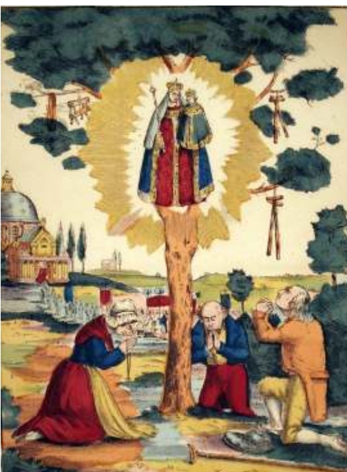
Wonder lamme genezen en kruk in de boom