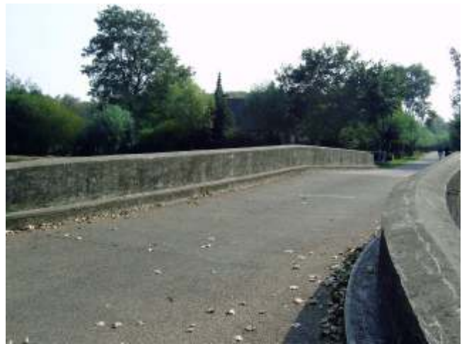
De Lage- of Kasteelbrug

Tegenwoordig vormen de smalle straten van Esch weer een doorgangsroute voor veel verkeer. Helaas een probleem dat moeilijk op te lossen is en al jaren speelt.