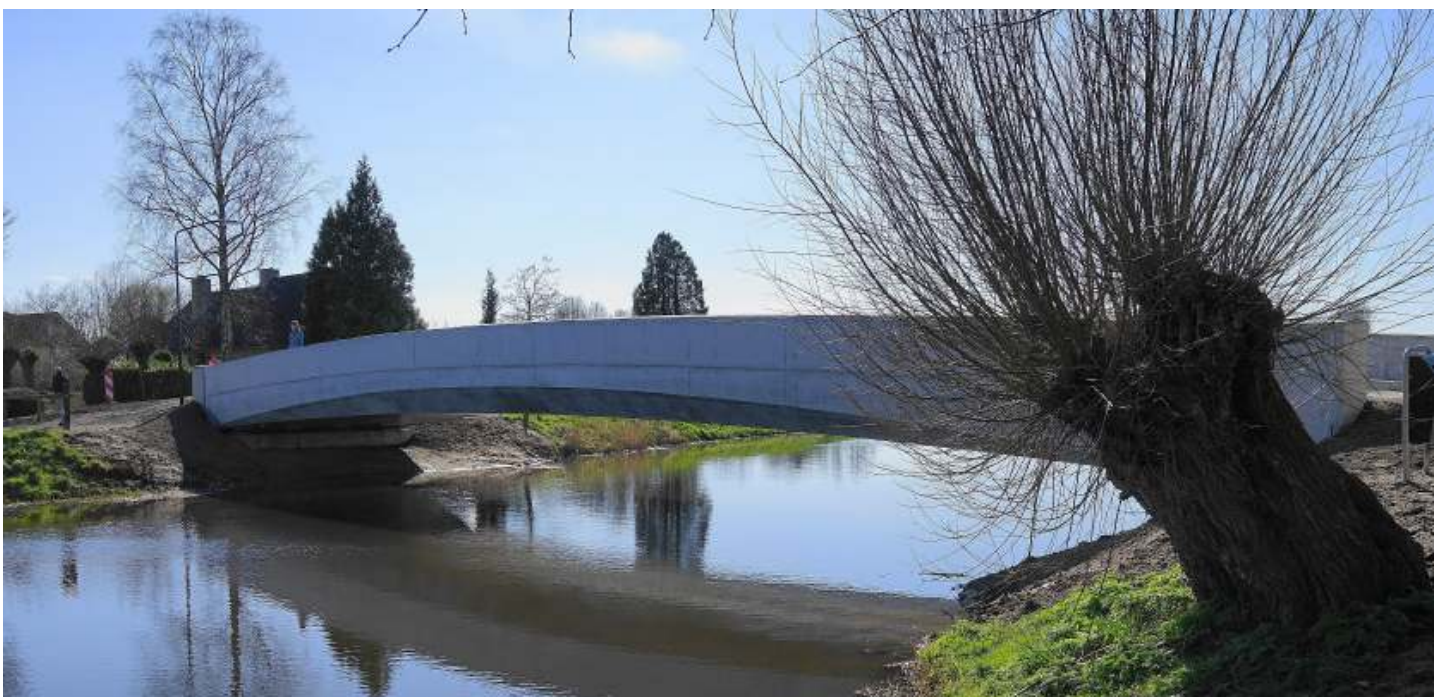
De nieuwe brug in de Spankerstraat te Esch.