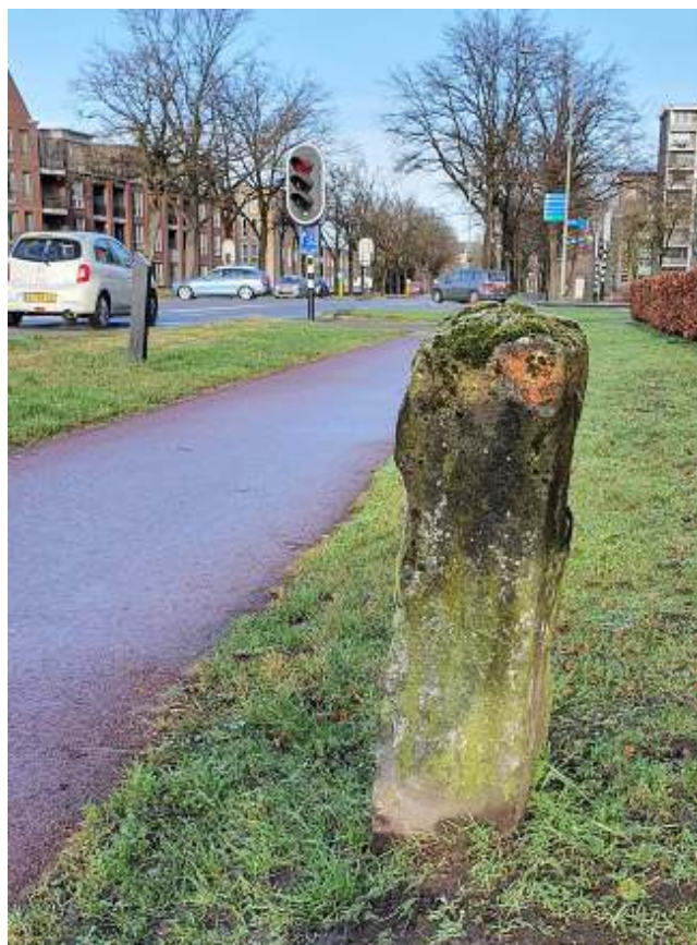
Het betonnen paaltje in de berm bij appartementencomplex Alidade. Links van de verkeerslichten zien we Vinckenrode

Misschien zou men in Boxtel deze twee paaltjes als 'historisch erfgoed' kunnen beschouwen en een mooie schilderbeurt kunnen geven waarbij de bovenkant dan weer oranje geschilderd wordt. Kijk zelf eens rond en wie nog meer van deze paaltjes langs de Brederodeweg vindt mag het aan de redactie van de Boxtel Kroniek bekend maken.