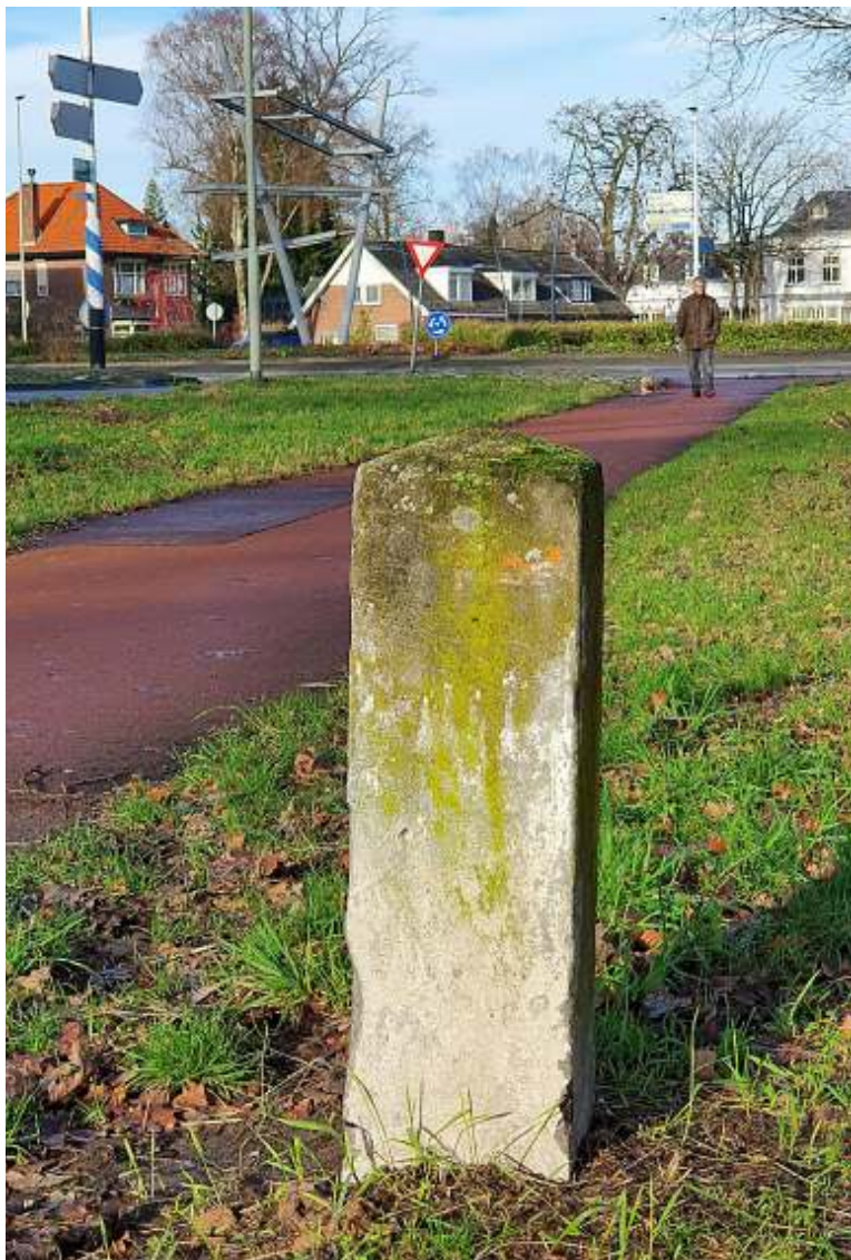
Vanaf het einde van de jaren 30 tot 1976 stonden langs voorrangswegen deze betonnen paaltjes.

Soms zie je objecten in het straatbeeld waarvan je dacht dat die allang verdwenen waren. Zo zagen we vroeger bij voetgangersoversteekplaatsen wel eens een oranje knipperbol. Je ziet ze nergens