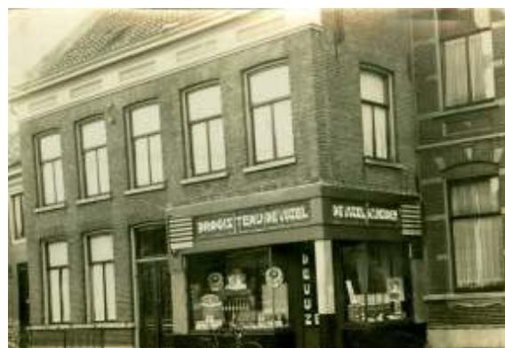
Drogisterij De Vijzel en later (2022) Café DOK12

In de krant Het Huisgezin van 29-12-1926 staat dat hij gedurende de oorlogsjaren (1 e Wereldoorlog) medicus in Hongarije was. Hij heeft echter medicijnen gestudeerd in Groningen. Mogelijk had hij al zijn artsdiploma in Hongarije en was dit hier niet geldig. Al met al heeft de familie een bewogen leven achter de rug.