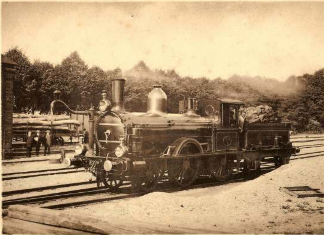
No. 1 LOCOMOTIEF 1873

wissel tot stoppen gedwongen en opgewacht door een ingenieur van de SS, de kantonrechter van Boxtel mr. De Roy, opvolger van de mede-initiatiefnemer van de NBDS Verster en twee leden van de Koninklijke Marechaussee. Na een vruchteloze discussie wordt duidelijk dat de trein niet toegelaten zal worden. De reizigers moeten uitstappen en lopend over het ballastbed naar het 600 meter verderop gelegen station naar hun aansluitende treinen. Reizigers voor de richting Gennep moeten dezelfde weg in omgekeerde richting lopen. Pas op 19 juli 1873 is de discussie voorbij, onder andere door de landelijke pers die van het incident smult.