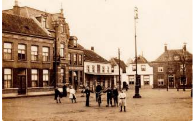
De Markt omstreeks 1923

In 1919 ontvangt men in Nederland radiosignalen helemaal vanuit 'ons Indië.' Deze worden via antennes op een hoogvlakte in de buurt van de stad Bandoeng verspreid. Nauwelijks gaat 1923 van start, of in datzelfde Bandoeng worden de eerste signalen ontvangen vanuit Nederland, waarmee de weg voor een geregelde radioverbinding tussen ons land en de gordel van smaragd een aanvang neemt. 'Hallo Bandoeng' groeit aan beide zijden van de wereld uit tot een nieuw synoniem voor luisterrijk. Het te bouwen zendstation 'radio Kootwijk' moet volledig waterdicht zijn zonder spijkers en hout. Het gebouw wordt opgetrokken uit gewapend beton en is daarmee het eerste grote complex van dat materiaal. Opvallend is dat de constructie niet wordt bekleed met een ander materiaal, waardoor het beton van het inmiddels rijksmonument zichtbaar blijft. Nu een eeuw later is mondiale communicatie onlosmakelijk verbonden met het bevorderen van een duurzaam contact tussen alle wereldbewoners. De wereld wordt met de dag kleiner.