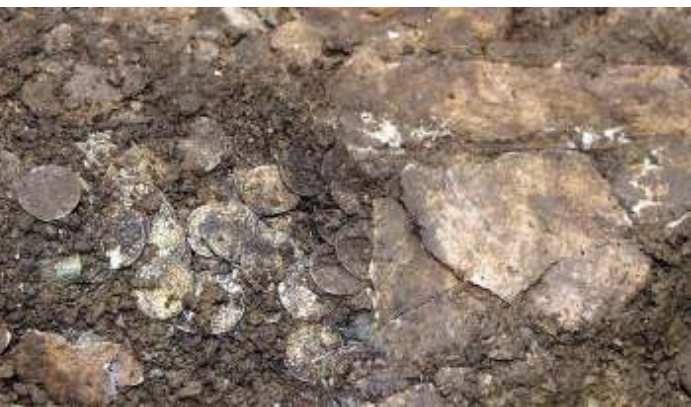
Een middeleeuwse muntschat gevonden in Engeland