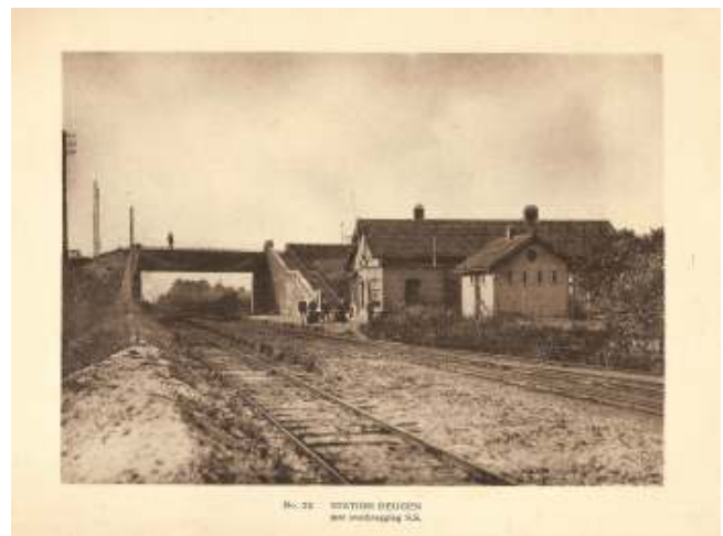
Kruispunt Beugen met station Beugen-Laaq aan de NBDS-lijn

Tussen NBDS en SS is in die eerste periode sprake van felle concurrentie. Het is het Staatsspoor, dat die strijd het fanatiekste voert. Op de afbeelding is te zien dat er in Boxtel sprake is van gezamenlijk gebruik van het station. Op een andere plaats kruist de NBDS-lijn (het Duits Lijntje) de lijnen van de SS, namelijk kruispunt Beugen. Tijdens de aanleg van de staatslijn van Venlo naar Nijmegen is de NBDS-lijn al in exploitatie. De SS besluit haar spoorlijn omhoog te brengen en vermijdt daarmee de discussies die in die jaren strijk-en-zet zijn op stations met meerdere exploitanten, waarvan station Boxtel een extreem voorbeeld is.