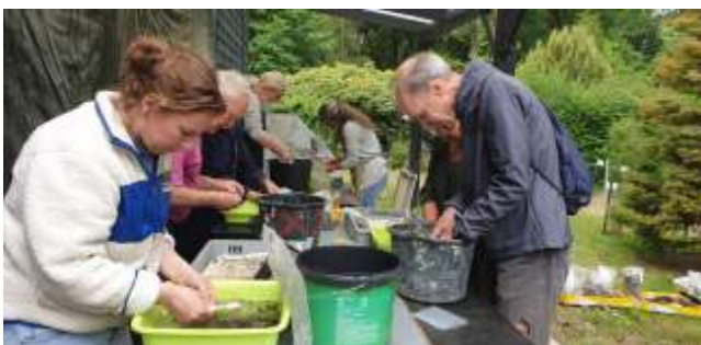
Het wassen van archeologische vondsten

rij. In het Oertijdmuseum is een ArcheoHotspot ingericht, die in 2021 een zelfstandige stichting is geworden. Van daaruit worden evenementen op archeologie-gebied georganiseerd.