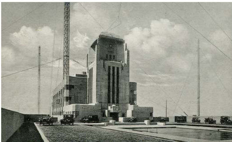
Radio Kootwijk Zendgebouw (lange golf)

1923 is toch een bijzonder jaar. De grote oorlog van '14-'18 met als nagerecht de verschrikking van de Spaanse griep wordt resoluut afgeschud door dans en plezier. De 'roaring twenties' steken de kop op. Ongebreideld optimisme, mede gevoed door de technologische vooruitgang viert hoogtij. Niet alleen de radio veroverd de wereld, ook de grammofoon brengt de wereld van muziek dichterbij. En het huishouden profiteert van de wasmachine, de stofzuiger en de koelkast. De werkgelegenheid stijgt met stip, bomen groeien tot in de he-