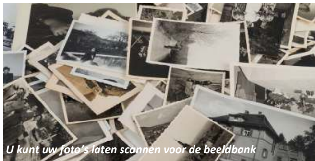
U kunt uw foto's laten scannen voor de beeldbank

Steeds meer mensen weten de weg naar de Heemkamer te vinden. Men komt voor een praatje of met vragen over een Boxtels onderwerp waar men meer van wil weten. Ook worden er steeds meer oude foto's gebracht voor de beeldbank. Soms wil men de foto's kwijt en verdwijnen ze na het digitaliseren in het heemkundefarchief. Maar wil men de foto's niet kwijt, dan worden ze netjes thuis gebracht na het scannen.