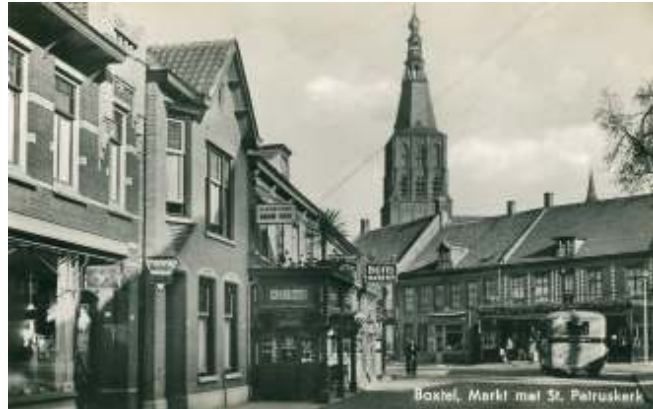
De St.-Petrustoren. De bovenste galmgaten, naast de wijzerplaten, zijn dichtgemetseld

De beiaard is een instrument dat onlosmakelijk is verbonden met de Lage Landen. In het huidige Nederland en België waren rond 1600 klokkengieters actief die zeer verfijnde beiaarden konden maken en daarmee de klokkenkunst tot grote hoogte wisten te tillen. Voor stadsbesturen was een eigen beiaard een symbool van welvaart en het gold als een sieraad; talloze steden werden dan ook verfraaid met dergelijke instrumenten. De hoogwaardigheid van de carillons blijkt wel uit het feit dat we vandaag de dag veel van deze instrumenten nog altijd kunnen horen. Loop door de binnenstad van Utrecht en je hoort het carillon van de Domtoren dat dateert uit 1663; in Deventer hoor je een carillon uit 1647 en in Haarlem een instrument uit 1661. Eén van de oudste carillons ter wereld hoor je in de Zuidhavenpoort van Zierikzee, waar de klokken uit 1550 dateren. In de loop der eeuwen zijn er veel nieuwe instrumenten bijgekomen en tegenwoordig heeft iedere gemeente in Nederland wel ergens een carillon dat automatisch of via het spel van een beiaardier de omgeving opvrolijkt. Ook is de beiaardkunst inmiddels flink over de wereld uitgewaaid. Nederland blijft evenwel interna-