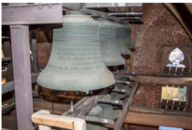
2017: Restauratie van de beiaard.

De opstelling van de beiaard was ten tijde van de ingebruikname niet ideaal. De klokken hingen vrij laag en gesloten, de bovenste rij galmgaten was indertijd dicht. Toen de toren in 1982 ingrijpend werd gerestaureerd, werden de bovenste galmgaten weer geopend en werd de beiaard door Eijsbouts over twee verdiepingen verspreid. Sindsdien is er een betere klankuitstraling. Lange tijd was Hans Kronenburg uit Eindhoven de vaste bespeler van het instrument; hij werd later opgevolgd door de Bossche stadsbeiaardier Joost van Balkom.