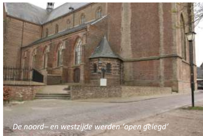
De noord- en westzijde werden 'open gelegd'

In 1923 is de Petruskerk 'open gelegd'. Hiermee bedoelt men dat de gebouwen die ten westen en ten noorden van kerk stonden werden afgebroken. Het terrein werd opnieuw aangelegd en voorzien van een plantsoen en een klinkerpad. Bij de nieuwe ingang van de kerk, via de toren, werd op advies van de Rijksmonumentencommissie een pleintje aangelegd, voorzien van brede trappen. In het streven om de kerk nog meer open te leggen werd aan de Hervormde kerk gevraagd onder welke voorwaarden hun kerk, pastorie en kerkhof te koop zouden zijn. Voor 125.000 gulden wilde men de kerk wel verkopen. Het bestuur van de Sint-Petrusparochie zag er toen maar vanaf.