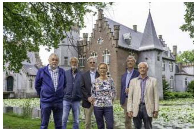
Het Heemkundebestuur in 2022.