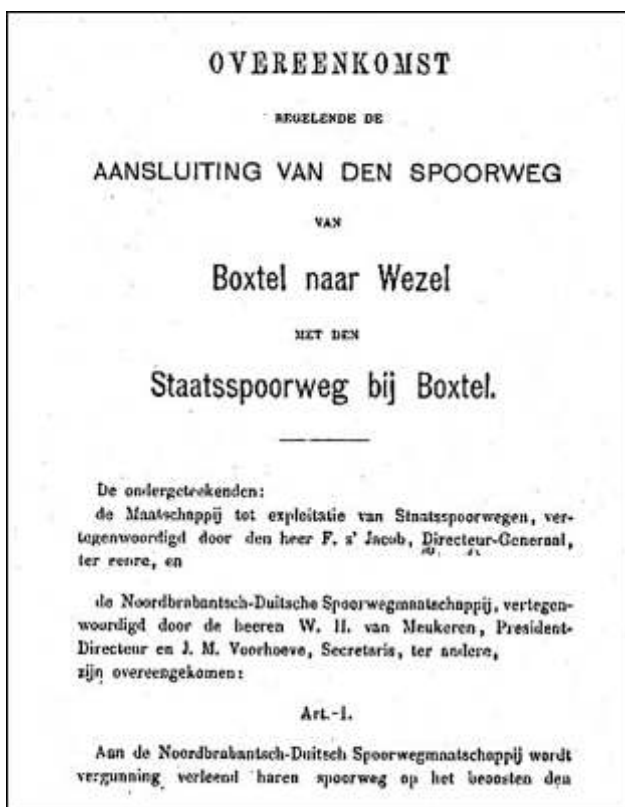
Voorblad van de eerste overeenkomst