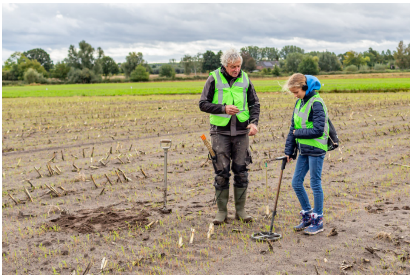
Akkerzoekers. Op 4 oktober 2020 werd op de Roosakker in Liempde door CARE en erfgoedvereniging Kèk Liemt voor jong en oud een 'veldloop' georganiseerd.

Stortzoekers zoeken vaak met een kleinere schotel, waardoor het minder mogelijk is dat er twee voorwerpen tegelijk onder de schotel liggen.