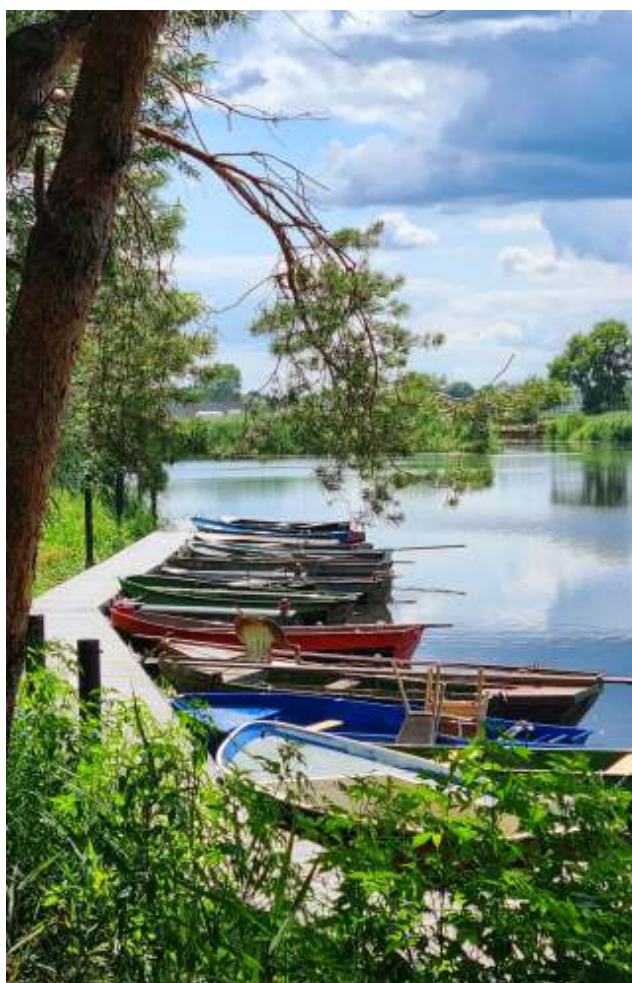
Roeibootjes bij de Hooibrug in juli 2022