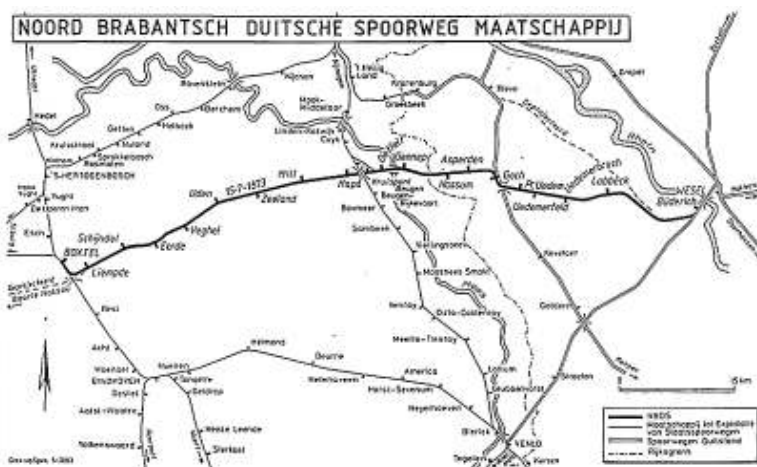
Het sporennet van de NBDS met de geprojecteerde spoorlijn Boxtel-Baarle Nassau

Op deze afbeelding is die kruising zichtbaar. De lage sporen zijn van de NBDS, het kruisende hoge spoor van de SS. We kijken onder het viaduct door richting Boxtel. Beide maatschappijen hebben hun eigen station: Beugen-Laaq voor de NBDS, Beugen-Hoog voor het SS (niet zichtbaar). Beide stationsgebouwen zijn verbonden met een trap en de treinen hebben dus geen last van elkaar. Maar SS wordt toch heel vervelend en de aansluitingen tussen boven- en onderlijn zijn bewust heel slecht.