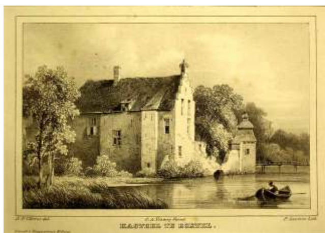
Tekening van J.F. Christ van het kasteel Stapelen te Boxtel

En nu hangt er dus ook een schilderij van Wouterus Verschuur sr. in Boxtel.