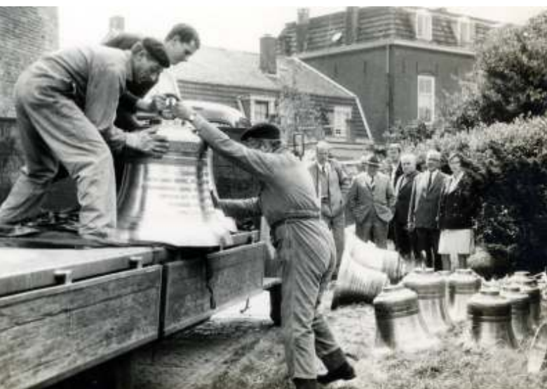
1968: Levering van nieuwe klokken voor de beiaard