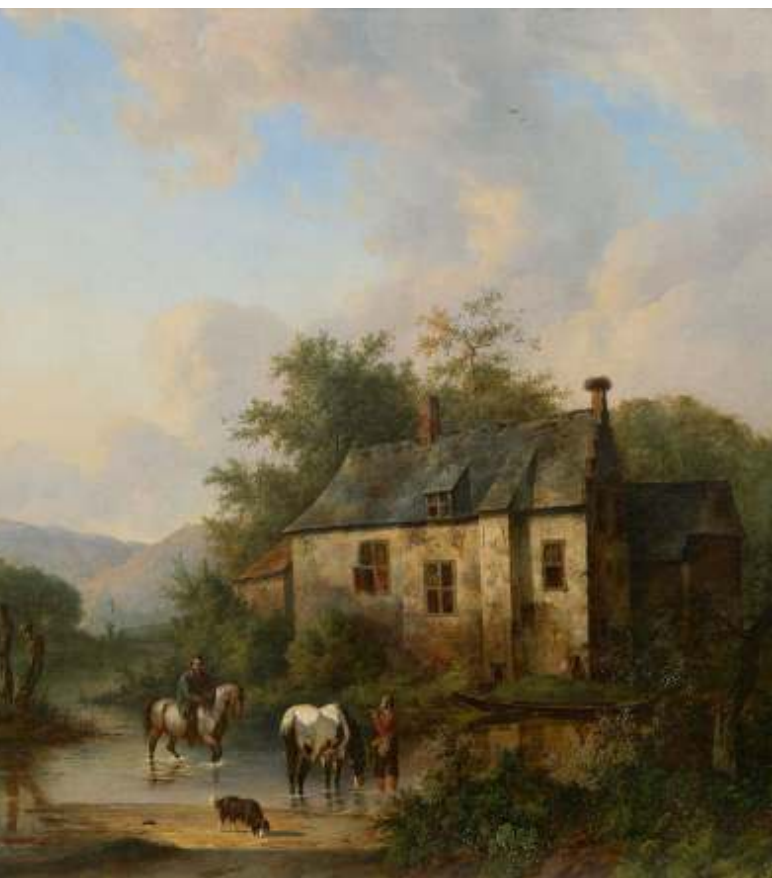
'Gezicht op Leenkamer van Kasteel Stapelen te Boxtel met hond, paarden en ruiters' door Wouterus Verschuur sr.

Schilderij van Kasteel Stapelen van meester-schilder Wouterus Verschuur sr. hangt sinds kort in Boxtel!