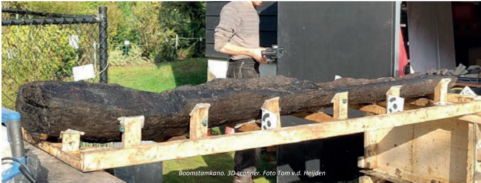
Boomstamkano. 3D scanner.

Archeologen zijn getraind om hun vondsten meteen in plastic zakjes te doen en te voorzien van een kaartje met gegevens. Toen in juni 2024 de archeologen van het Archeologisch Diensten Centrum (ADC) een boomstamkano vonden van 360 cm lang hebben ze die snel weer toegedekt.