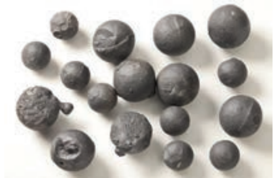
Loden musket- en pistoletkogels