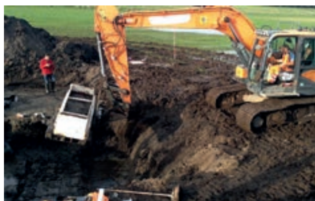
'Operatie Taartschep 2.0' in 2024.