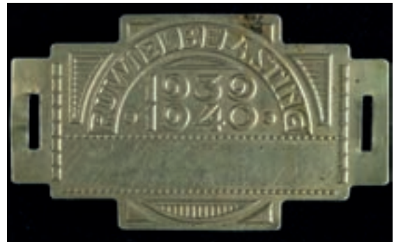
Rijwielbelastingplaatjes en fietsonderdelen

Na de Middeleeuwen tot de 19 e eeuw is de Nieuwe Tijd. Dit is een tijd van keizers, vorsten en regenten, naast de paus en bisschoppen. Duitsland bestond toen uit zo'n 300 kleine staatjes, met ieder een heerser, gewoonten, eigen munt- en gewichtstelsel. Uit deze periode vinden we dan ook veel: munten, knopen, gespen, kerkelijke zaken, paardenattributen, kogels, gewichten, lakenloodjes, kinderspeelgoed, militaire spullen, leer-, kast- en riembeslag, vingerhoedjes, emblemen, sleutels, vuursteenketen en nog veel meer. We vinden hier niet alleen voorwerpen van Nederlandse oorsprong, maar ook uit België, Frankrijk, Duitsland, Polen, Italië, Engeland, Ierland, Spanje, Portugal, Vaticaanstad en nog meer landen om ons heen.