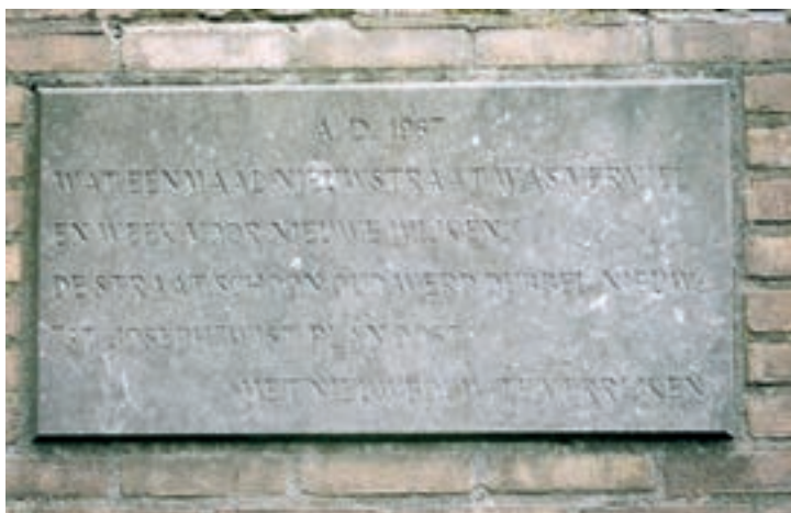
Bij de oplevering van de eerste woningen in nieuwbouwwijk Boxtel-Oost werd in 1967 deze steen ingemetseld in de zijgevel van Nieuwe Nieuwstraat 9. Foto Piet Rood 2002/2003

Foto's en teksten kunnen worden aangeleverd via e-mail: foto@heemkundeboxtel.nl .