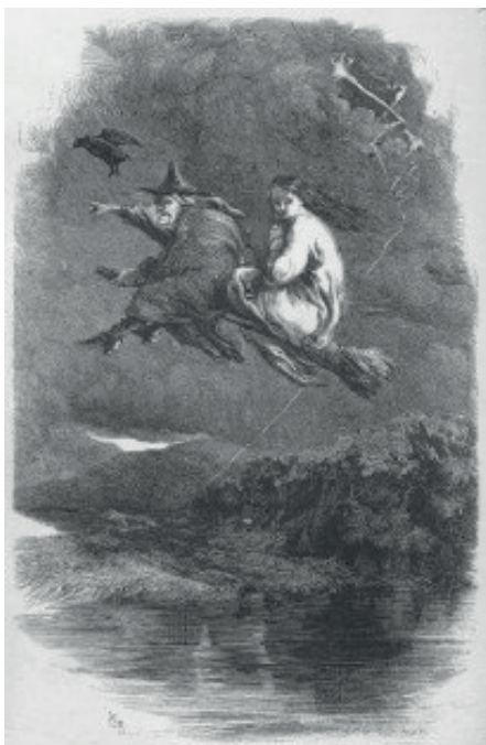
The Lancashire Witches van Harrison Ainsworth