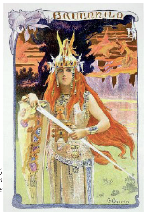
'Brunnhild' (1897) geschilderd door Gaston Bussière