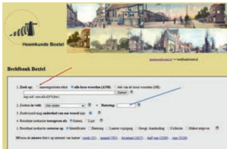
Beeldbank Boxtel (detail uit het zoekscherm)

Ook voor de bidprentjesboxtel geldt dat je kunt zoeken op naam, geboorteplaats, overlijdensplaats en geboortedatum. Het sorteren op de zoekresultaten kan in de vorm van een galerij of in een lijst. Dat geldt voor alle banken