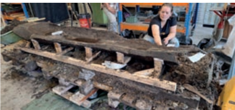
Werkzaamheden aan de kano in het Oertijdmuseum op 22 oktober 2024.

Op een aanhangertje is de kist met kano naar het laboratorium van het oertijdmuseum vervoerd. Daar is eerst de binnenkant voorzichtig leeg gemaakt. Daar kwamen geen grote voorwerpen uit. Daarna is onder de kano een draagconstructie gebouwd die de kano steunt. Toen die constructie gereed was, is ook het laatste zand onder de kano weg gehaald. Het weghalen van zand moest met de vingers of zachte spatels gebeuren om geen krassen op de huid van de kano te maken. We hopen dat experts door oude sporen op die huid informatie kunnen krijgen over de leeftijd van de kano.