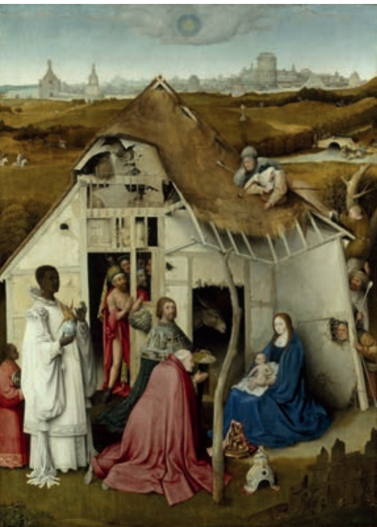
Aanbidding der koningen. Schilderij naar Jeroen Bosch

Driekoningen anno nu staat midden in een seculiere samenleving, waar de religieuze betekenis afneemt. Door globalisering ontstaan nieuwe fenomenen, zoals Halloween en Valentijnsdag, waarbij de commercie driftig om zich heen slaat. Tegelijkertijd ontstaat er een groeiende interesse voor tradities, die het vermogen bezitten om zich een nieuw jasje aan te meten, meer passend bij de tijdgeest. Zo wordt in Den Bosch tijdens de optocht een 4 e cadeautje toegevoegd, speelgoed voor kinderen die het niet al te breed hebben en staat het Driekoningenzingen in Tilburg op de UNESCO-lijst van Immaterieel Erfgoed. En vergeet niet onze eigen dorpen, waar Driekoningen de komende dagen op een wat bescheidener wijze wordt ingevuld. Of Driekoningen toekomst heeft, hangt dus grotendeels van onszelf af.