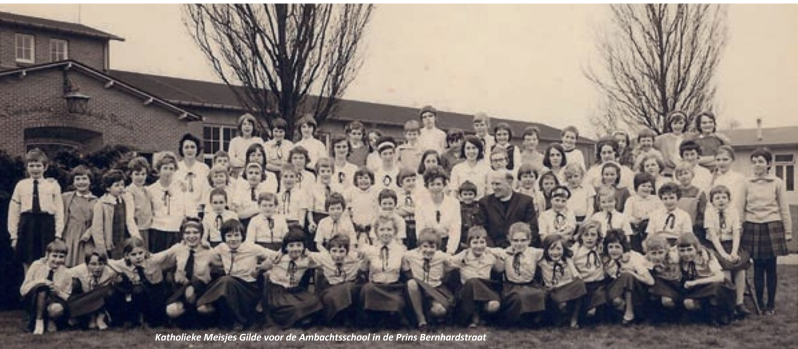
Katholieke Meisjes Gilde voor de Ambachtsschool in de Prins Bernhardstraat