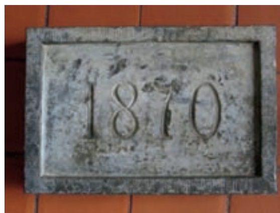
Gevelsteen uit boerderij aan de Elzengaard. De steen werd in de grond gevonden nadat de boerderij gesloopt was.