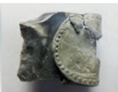
vuurkets met loden houder