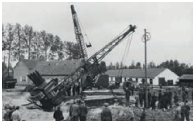
'Operatie Taartschep' 1961

Er stonden op de dag van de werkzaamheden veel