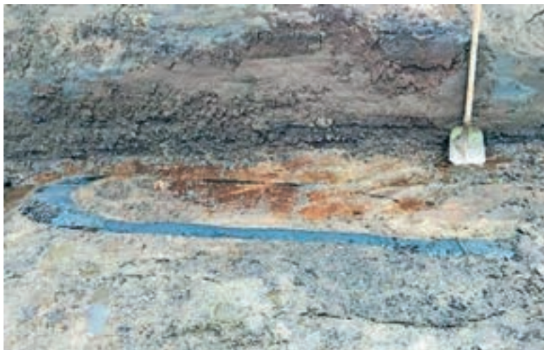
De kano in juni 2024.

Archeologen zijn getraind om hun vondsten meteen in plastic zakjes te doen en te voorzien van een kaartje met gegevens. Toen in juni 2024 de archeologen van het Archeologisch Diensten Centrum (ADC) een boomstamkano vonden van 360 cm lang hebben ze die snel weer toegedekt.