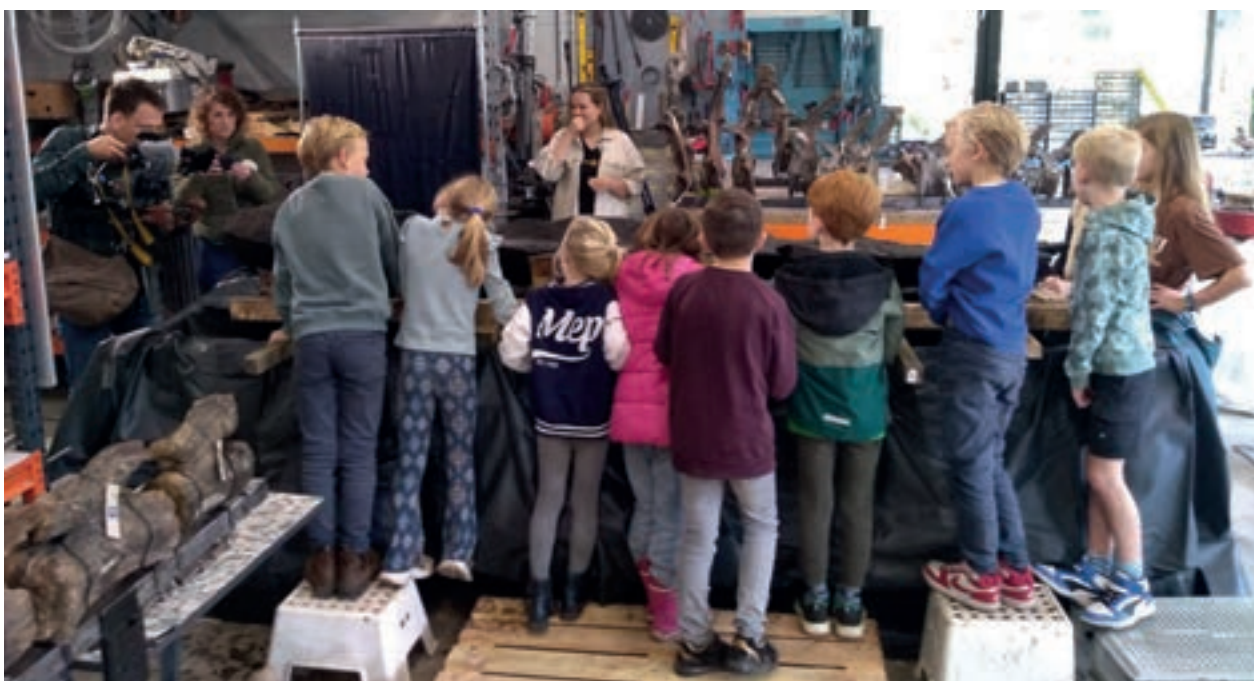
'Opname jeugdjournaal'

kano lijkt 9.000 jaar geleden uitgehold te zijn. Dat was ver voor de bronstijd. Het uithollen zal vooral met vuurstenen werktuigen gedaan zijn. Voor deze kano van eikenhout moet dat uithollen een zware opgave geweest zijn. De leeftijd kan in dit geval niet met jaarringen onderzocht worden, omdat het materiaal tussen de jaarringen al enigszins vergaan is. Wel is dat mogelijk met de C14 methode, waar met koolstof de ouderdom van organisch materiaal bepaald kan worden. C14 datering vergt bijna een half jaar, dus meer hierover in een volgende Boxtel Kroniek.