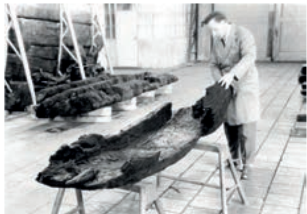
Kano uit de Essche Stroom. Foto 1964 Museum Batavialand

In 1964 is ook al een boomstamkano naar boven gehaald in Esch. Die kano werd niet door archeologen gevonden, maar door een dragline-machinist