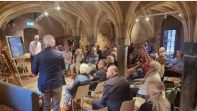
Heemkunde Boxtel in de kelder van het oude gemeentehuis van Oirschot.

Voor de excursie naar ASML hadden zich vijftig personen opgegeven, terwijl ASML maar 25 bezoekers van Heemkunde Boxtel kon toelaten. Het was een zeer interessante excursie.