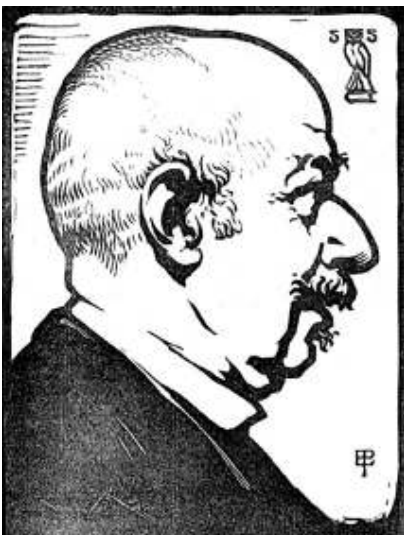
Fernand Donnet, houtsnede Edward Pellens, 1921