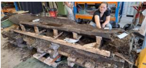
Werkzaamheden aan de in Esch opgegraven boomstamkano. 22 oktober 2024 in het Oertijdmuseum