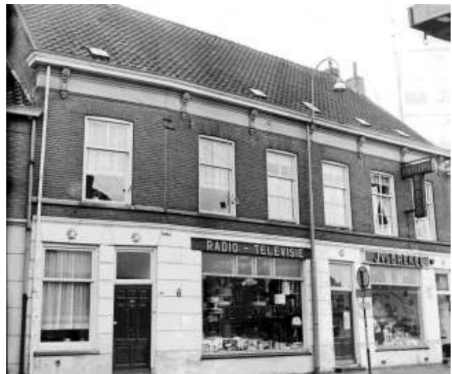
Eén van de laatste foto's die toegevoegd werd aan de Beeldbank Boxtel. De voorgevel van de radio- en televisiewinkel J. van den Brekel in de Rechterstraat.

Met meer dan 64.000 foto's van (oud) Boxtel blijft de beeldbank ( www.beeldbankboxtel.nl ) een ware trekpleister. Vorig jaar telden we 20.246 bezoekers, die samen 194.128 foto's bekeken. Elke maand worden nieuwe foto's toegevoegd. Beheer: Dik Bol (systeem) en Christ van Eekelen (data).