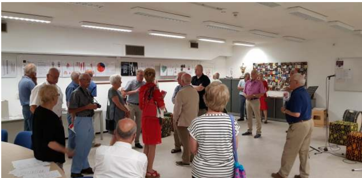
2018 Heemkunde Boxtel op excursie in de atoombunker van het provinciehuis in 's-Hertogenbosch.

Verenigde Staten en de Sovjet-Unie, zorgt de ideologische strijd en voortdurende rivaliteit voor onzekerheid en angst tot uiteindelijk in 1991 de Sovjet-Unie uiteenvalt en de Koude Oorlog daarmee ten einde komt. De vlag kan in top als het ene na het andere land kiest voor vrijheid en democratie. Zelfs de muur in Berlijn wordt geslecht, terwijl uitzinnige Oost-Duitsers in hun Trabantjes richting het vrije westen koersen.