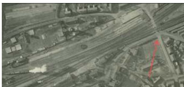
De rode pijl geeft de plaats aan waar de voetbrug gebouwd gaat worden

wijst naar de nog steeds bestaande driesprong Spoorstraat-Brugstraat-Baroniestraat.