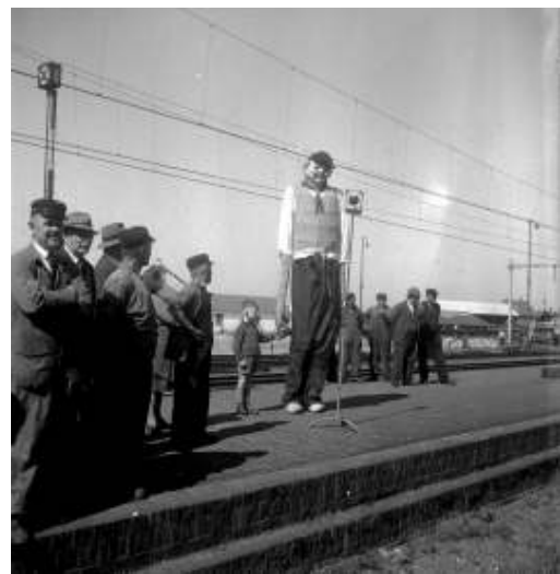
'Feestelijke onthaal van de genodigden door een groep kinderen en 'Jas de Keistamper' op het perron van het N.S.-station te Boxtel ter gelegenheid van de electrificatie van de spoorlijnen in Noord-Brabant'

Tot 13 april kun je in Mubo de tentoonstelling 'Boxtel Vooruit 100 jaar' bezoeken.