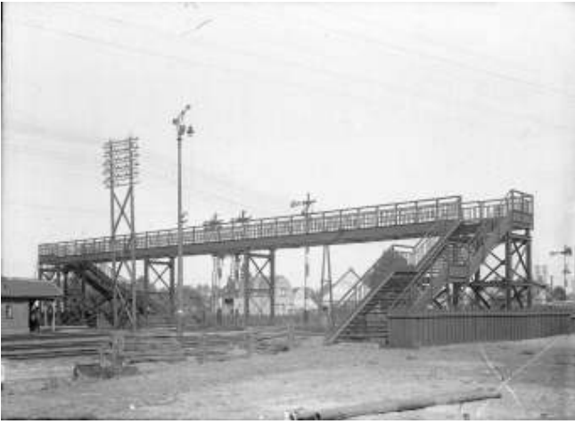
De voetbrug werd gebouwd in 1928

Na het herstel werd de brug nog vele jaren met plezier gebruikt en veel mensen hebben er nog warme herinneringen aan. Hoe warm, bleek ook door het grote aantal belangstellenden dat vanaf de voetbrug stond te kij-