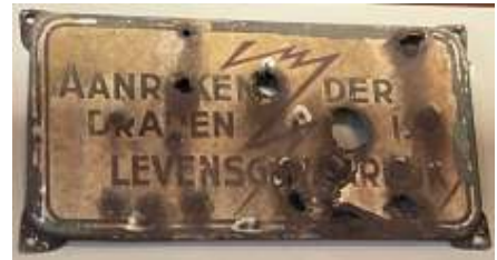
Bordje van de voetbrug werd gered

Een laatste restant van de brug hangt dan ook bij deze familie thuis aan de muur, gered van de sloop.