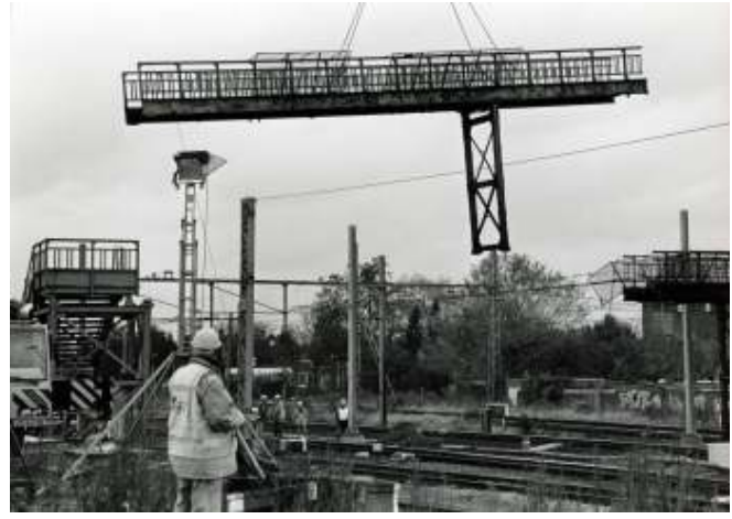
In 1997 werd de voetbrug gesloopt

ken toen meubelfabriek Novum in brand stond. Erg gezond kan het niet geweest zijn als je weet hoe dicht die brandende fabriek aan het spoor stond. Maar wel een goed uitzicht.