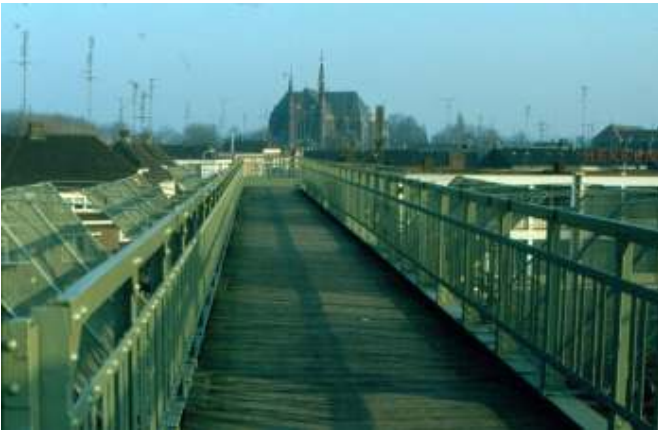
Op de voetbrug, gezien vanuit de Van Salmstraat met op de achtergrond de H. Hartkerk

Na het herstel werd de brug nog vele jaren met plezier gebruikt en veel mensen hebben er nog warme herinneringen aan. Hoe warm, bleek ook door het grote aantal belangstellenden dat vanaf de voetbrug stond te kij-