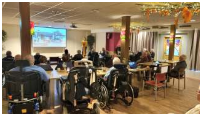
Het voorlezen van verhaaltjes bij de Honderd verdwenen gebouwen in de zaal van het Liduina verpleeghuis