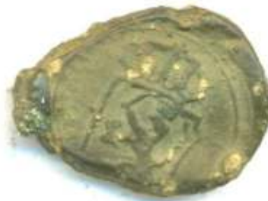
Gevonden in Boxtel