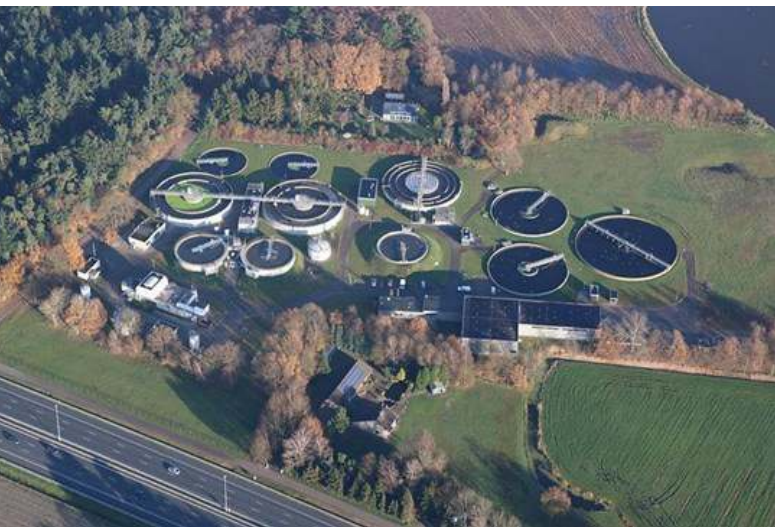
Rioolwaterzuiveringsinstallatie Boxtel – Waterschap De Dommel

houden. Ook het zuiveringsproces van rioolwater moet hierop worden aangepast. Dat vraagt om nieuwe zuiveringstechnieken en aanzienlijke investeringen. Een nadere beschrijving van dit proces kan in een volgend artikel aan bod komen. Daarnaast is het mogelijk om via de afdeling voorlichting van het waterschap een excursie aan te vragen.