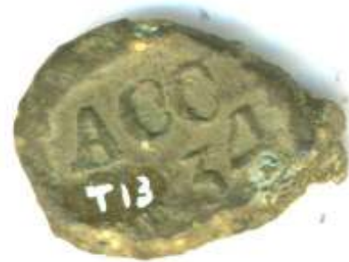
Gevonden in Boxtel