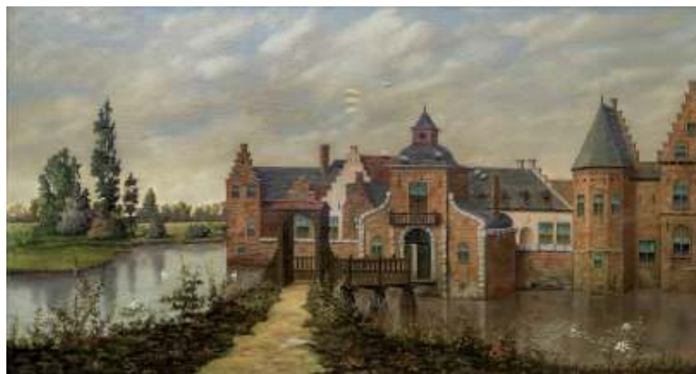
Kasteel Stapelen door Frans Kops, vermoedelijk nageschilderd van een prent uit de 17e of 18e eeuw.

Aan de rand van dit deltalandschap staat Kasteel Stapelen, dat al sinds de dertiende eeuw over Boxtel waakt. Het draagt zijn geschiedenis zichtbaar met zich mee: middeleeuwse fundamenten, zeventiende-eeuwse pracht, negentiende-eeuwse restauraties en de stille voetstappen van de Assumptionisten die hier ooit door de gangen trokken. Het is een plek van strijd, geloof, rust en nu van creatie. In 2046 is Stapelen geen museum, maar een levendige werkplaats van de tijd. Jongeren buigen zich over eeuwenoud hout en lezen de patronen. Ambachtslieden, meesters in oude tradities, leren hen hoe je een balk leest