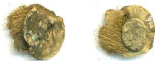
Gevonden in Boxtel

Er waren nog veel meer soorten accijnzen waarbij men loodjes gebruikte. Denk aan accijnzen voor suiker, zout, koffie, azijn, turf, steenkolen, wijn, bier en sterke drank.