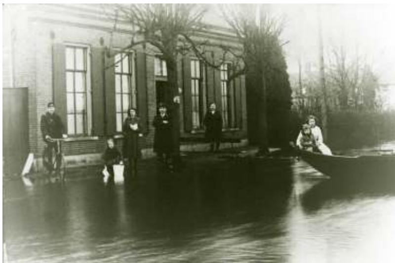
De Dommel is buiten haar oevers getreden, Eindhovenseweg

Bij mijn vertrek als voorzitter van Heemkunde Boxtel wil ik een bespiegeling delen: Heemkunde richt zich op het terugkijken, het bewaren van wat dreigt te verdwijnen en het doorgeven van wat betekenis heeft. Het heden staat nooit stil; het is opgebouwd uit het verleden en de keuzes die wij maken. Vandaag richt ik mijn blik graag op de toekomst, naar het Boxtel van 2046. Niet als voorspelling, maar als oefening in verbeeldingskracht. Wat voor dorp wil Boxtel zijn? En hoe zou dat eruitzien wanneer we de lijn van ons verleden doortrekken naar de toekomst? Ik stel me voor dat ik in de schoenen stap van een denkbeeldige bewoner van Boxtel ergens in 2046, een jaar dat misschien niet voor iedereen weggelegd is, maar waarvan ik geloof dat het nu al zichtbaar wordt in de keuzes die we vandaag maken.