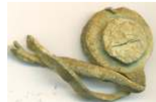
Gevonden in Boxtel, bij dit lood zitten de lange verbindingsstrips er nog aan.