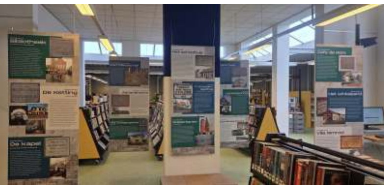
Expositie 'Sprekende stenen' in de bibliotheek

Van 1 september tot 31 december 2025 werd in de bibliotheek een expositie gehouden met als titel 'Sprekende stenen'. Het betrof een selectie foto's uit een collectie van meer dan 100 (eerste) stenen, die elk een verhaal vertellen.