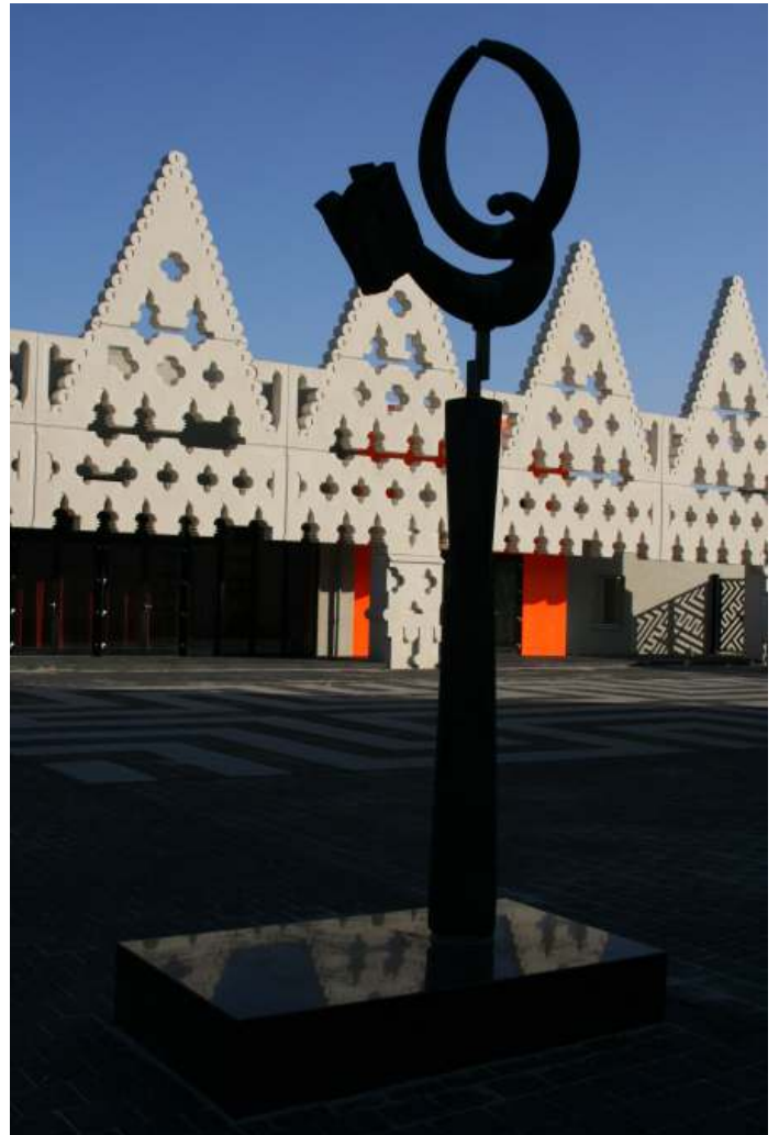
Het futuristische gebouw van SintLucas aan de Burgakker.

komst heeft verwelkomd zoals het dat altijd deed: met geduld, respect en een koppige liefde voor wat werkt. Niet zozeer groter, maar wijzer, niet sneller, maar bedachtzamer, niet spectaculairder, maar dieper. De toekomst van Boxtel begon niet met technologie, maar met keuzes. Met luisteren naar het water, vertrouwen in het landschap en de gemeenschap, en het besef dat vernieuwing pas betekenis krijgt wanneer zij wortelt in wie je bent en wat je wilt zijn.