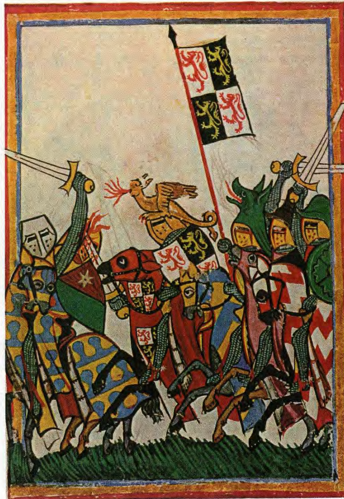
De slag bij Woeringen. Op de helm van hertog Jan I een vuurspuwende draak

Deze bekende veldslag bij Woeringen wordt rond 1290 door de historiograaf Jan van Heelu (ofwel Van Leeuwen) in een rijmkroniek beschreven. 18 Hij componeert zijn heldendicht voor een hoofs, ridderlijk auditorium. Want een dergelijk heldhaftig epos voordragen past toch uitstekend bij feestelijke bijeenkomsten aan het hertogelijke hof of in de ridderzalen van andere helden van Woeringen. Daarom roemt hij de heldhaftige daden van alle deelnemers aan Brabantse zijde. Hij wil niemand overslaan en niemand in zijn eer krenken. De historische feiten die erin vermeld worden, zijn zeker betrouwbaar, omdat Heelu als ooggetuige van de veldslag al twee jaar na dit gevecht zijn oeuvre schrijft. Maar zijn interpretaties zijn 'Brabants' gekleurd . 19 De kroniekschrijver draagt zijn werk immers op aan Margaretha van York, de Engelse koningsdochter en de verloofde van Jan II, de oudste zoon van hertog Jan I van Brabant. Bovendien heeft hertog Jan I of anders zeker één van zijn leenmannen uit het Nederlandse deel van zijn hertogdom aan Heelu opdracht gegeven om dit epos te schrijven.