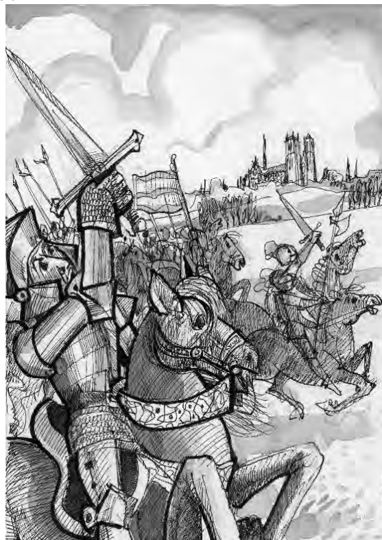
Met zijn ruiters trekt baanderheer Van Ranst ten strijde

Het aantal soldaten, dat onder de vierkantige banier van een baanderheer moet aantreden, is afhankelijk van de financiële waarde van zijn heerlijkheid. Daarover worden wij geïnformeerd via een ordonnantie van Maximiliaan van Oostenrijk in 1488. 27 Op zijn bevel moeten de hertogelijke leenmannen die een heerlijkheid met een hoge, middel en lage jurisdictie in leen hebben, en die jaarlijks twee honderd kronen aan het hertogelijk leenhof afdragen, met een kleine afdeling ruitery (= 'glavie' ) ten strijde trekken . Is de waarde van een dergelijke heerlijkheid honderd kronen waard, dan moet slechts één ruiters te paard aantreden. En is een dergelijke heerlijkheid maar vijftig kronen waard, dan moet één man zich bij het voetvolk melden.