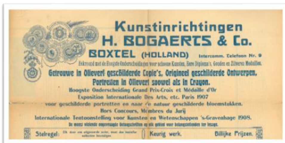
Bovenste gedeelte van de voorpagina van een publiciteitskrant van Kunstinrichtingen H. Bogaerts & Co. uitgegeven te Boxtel in ten vroegste 1908

Naast reproducties maakte Peinture Bogaerts ook peintures in de vorm van geschilderde portretten in kleur die naar (toentertijd zwart-wit) foto's werden gemaakt. Men kon eenvoudig een foto naar het bedrijf opsturen of naar een vertegenwoordiger van het bedrijf, tezamen met een haarlok en opgave van de kleur van de ogen (zie blz. 21 rechts : deel van een publiciteitskrant van Kunstinrichtingen H. Bogaerts & Co. uitgegeven te Boxtel in ten vroegste 1908). Van de foto werd in de donkere kamer een lithografie gemaakt die men in spiegelbeeld op geprepareerd schilderslinnen afdruckte. Op de inkt bracht men een doorzichtig laagje aan waarop geschilderd kon worden zonder dat de inkt zich met de verf kon mengen. De kunstschilder gebruikte de afdruck van de donkere gedeelten van het gezicht, zoals het haar, als onderliggende tekening. Deze donkere laag is soms nog zichtbaar. De haar- en schaduwgedeelten werden door dunne lagen olieverf overschilderd zodat de donkere, gedrukte laag eronder nog voldoende zichtbaar was. Handen, kleding en achtergrond werden met een dikke laag olieverf geschilderd. Zie ook : https://nl.wikipedia.org/wiki/Peinture_Bogaerts en https://nl.wikipedia.org/wiki/Henri_Bogaerts