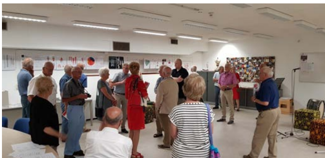
Bezoek aan de atoomkelder