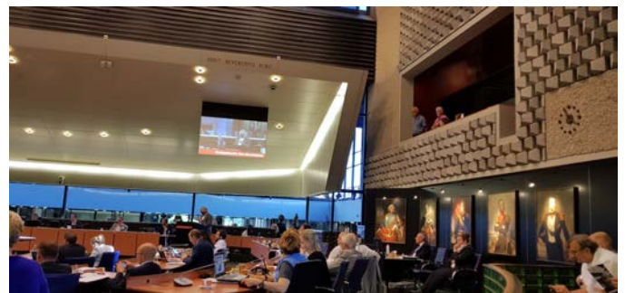
vergadering van de Provinciale Staten