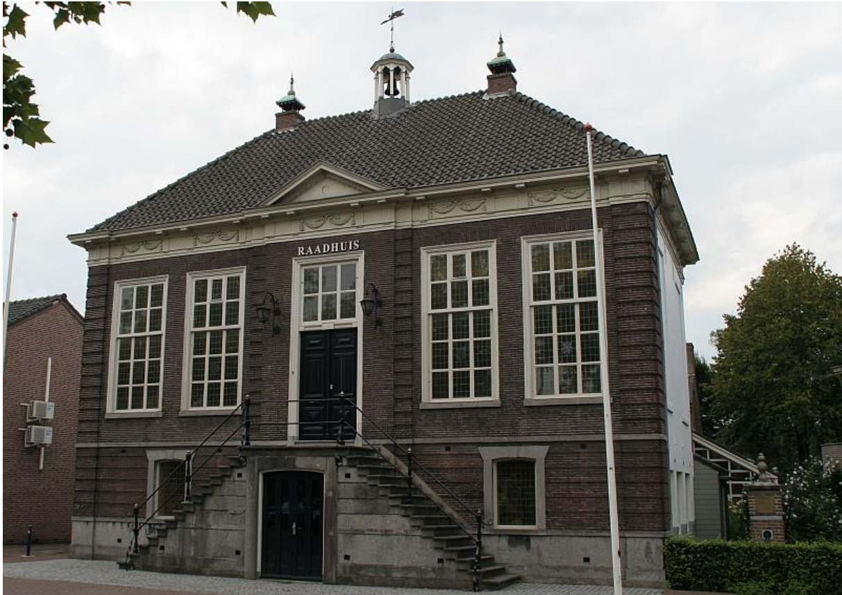
Raadhuis te Erp (thans gemeente Veghel), ontwerp van Hendrik Verhees uit 1791