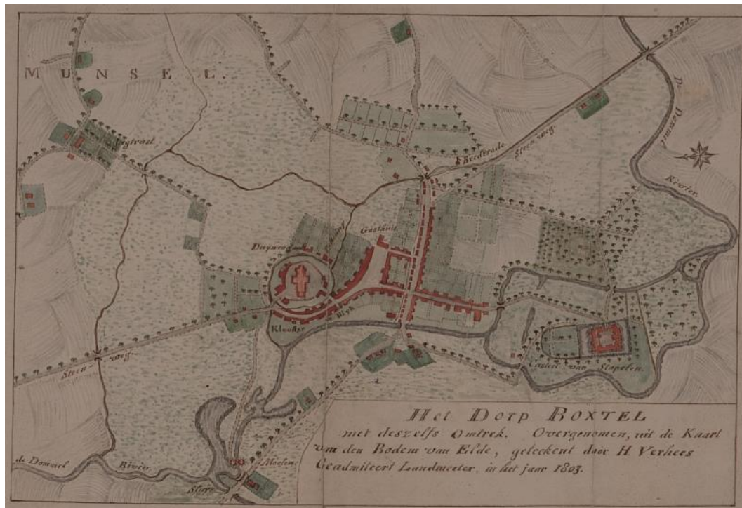
Detail van Verhees' kaart van de Bodem van Elde uit 1803: het dorp Boxtel