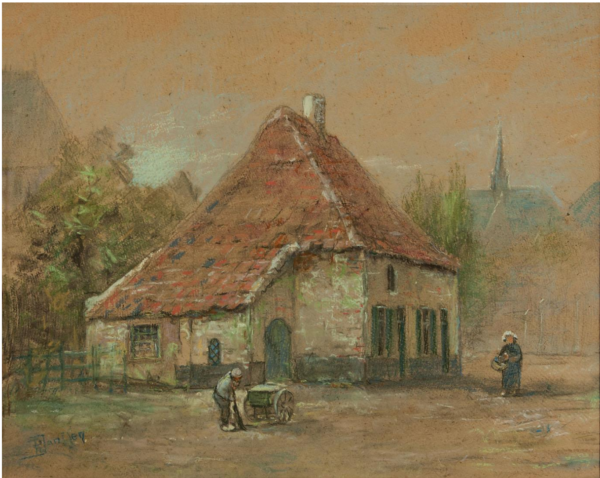
Kanunnikenhuisje op Duinendaal 2

In Boxtel woonde hij aanvankelijk in bij de grof- en hoefsmid Theodorus van Son in de Kruisstraat. Hij begon in Boxtel als medewerker bij Kunstinrichting Peinture Bogaerts in de Molenstraat. Daar heeft hij zich verder bekwaamd in het tekenen en schilderen. 'Een schilder van het Brabants schoon, conservatief in goeden zin', zoals hij zichzelf omschreef. Hij schilderde Brabantse landschappen, dorpsgezichten, portretten, stillevens en gebouwen, zowel interieurs als exterieurs. Meer naamsbekendheid kreeg hij toen Cr. A. Arnoldus namens de redactie van de Katholieke Illustratie bij hem op bezoek kwam. Christiaan Abel Arnoldus was de broer van Janssens vrouw. Het verhaal gaat dat Arnoldus hem zou hebben gezegd: "Zo, nu kom ik eens een verhaal over u schrijven, zodat u bekend wordt in heel ons land." De toon van het artikel was in ieder geval zeer positief: 'Deze fijnvoelende mensch (...) tooverd ons op zijn breed en vlot gepenseelde doeken den rijkdom van het leven van alle dag. Overal speurt zijn kunstzin het schoone, niet het minst in de stemmingvolle binnenhuisjes. Hoe weet hij de atmosfeer te treffen, den toon van dien rookerigen haard, het grijze licht op tafel en stoelen, het rood en leigrauwe van den plavuizen vloer. En het geheel steeds verlucht met eenige pikante figuurtjes, vooral vrouwtjes en kinderen.'