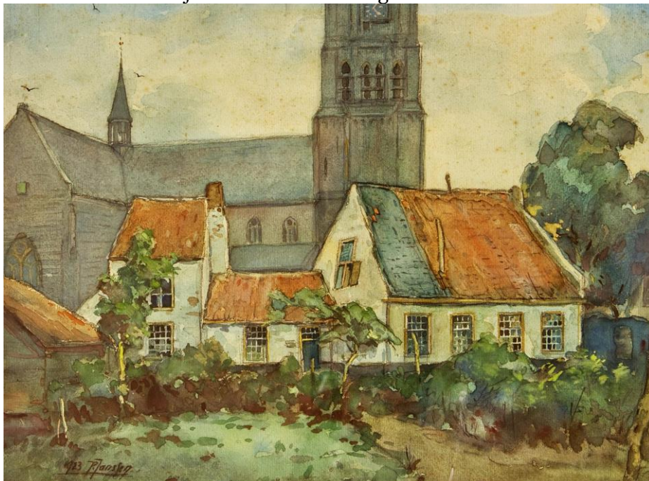
St.-Petrusbasiliek met Vincentiuskamer 7

We gaan terug in de tijd, naar het jaar 1923. Toen vond er een grote restauratie van de St.-Petruskerk plaats. Een paar in het oog springende zaken veranderden in dat jaar. In 1923 was de kerk 'opengelegd', dat wil zeggen dat de ten westen en noorden staande gebouwtjes, onder meer de torenschoon en de St.-Vincentiuskamer, toen werden weggebroken en dat het terrein opnieuw werd ingericht met aanleg van plantsoen en klinkerpad. Het koepeltorentje op de viering was in 1923 vervangen door een neogotisch torentje (spits torentje). Wat opvalt aan de kerkschilderijen van Janssen is, dat hij de kerk altijd geschilderd heeft alsof het 1923 was. Op nagenoeg alle schilderijen die een zicht geven vanuit de Clarissenstraat of Koppel, staan de huisjes afgebeeld die in 1923 werden afgebroken. Op alle schilderijen staat het 'nieuwe' torentje op de viering, namelijk het spitse torentje. Een groot aantal schilderijen van de St.-Petruskerk is niet gedateerd. Maar op een achttal staat als datum van schilderen 1934, 1935, 1943, 1945, 1947 en 1952. Omdat er niet één schilderij werd gevonden met het ronde koepeltorentje op de viering doet vermoeden, dat Janssen de St.-Petruskerk nooit vóór 1923 heeft geschilderd, terwijl hij toen al 25 jaar in Boxtel woonde. En in 1935 schilderde hij huisjes voor de kerk die twaalf jaar eerder werden afgebroken.