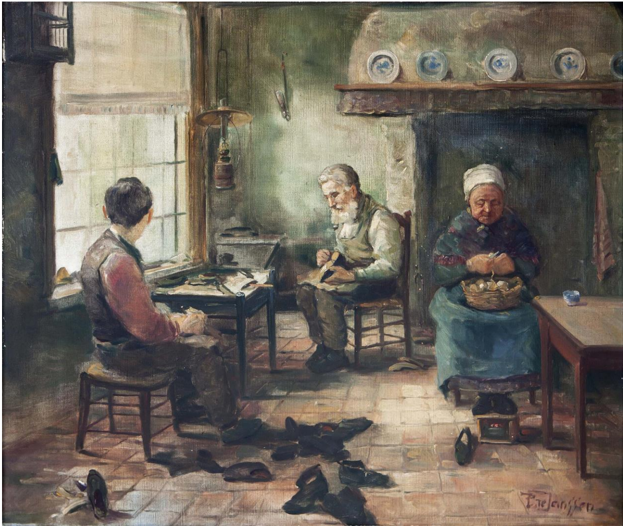
Jan de Pieper 3