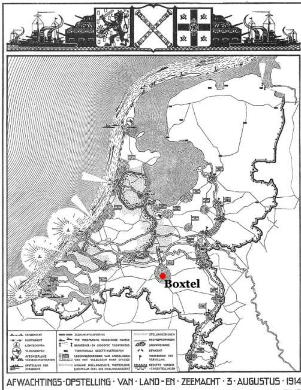
Kaart van gemobiliseerd Nederland. De vlaggetjes markeren de legeringsgebieden van de divisies van het veldleger. In Noord-Brabant staat het hele gebied ten zuiden van 's-Hertogenbosch als zodanig gemarkeerd. Hieronder vallen Vught, Sint-Michielsgestel, Oisterwijk en Bostel (in rood). Dit zijn tevens de dorpen rondom de knooppunten van de zuidelijke spoorlijnen. Bewerking van: Moeyes, Buiten schot, p. 70.