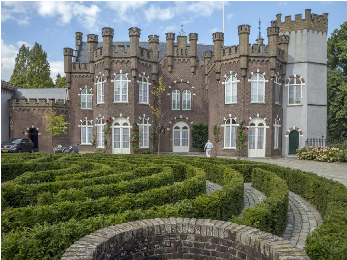
noordzijde (vanuit binnencour)

Steken we langs de eeuwenoude waterput de binnencour over dan komen we aan de noordzijde bij het “ nieuwe kasteel ”, bestaande uit een rechthoekig wooncomplex met rechts en links naar het zuiden gerichte gebouwen. Langs de oostkant van de gracht rijst de vijfzijdige muurtoren op, die in 1858 zijn schilddak verloor, met een nieuwe geleding werd verhoogd en bekroond met borstwering en kantelen zoals ook de andere torens. De benedenkamer komt uit op een van de door Mahie geconstrueerde paviljoenachtige uitbouwen die toen tuinkamer was maar nu als eetzaal dienst doet. Evenals de aansluitende recreatiezaal bezit zij een fraai stuckplafond. Aan de van oost naar west lopende gang ligt de ontvangstkamer en het trappenhuis dat voert naar de bovenverdieping. Onlangs werden hier enkele verouderde woonkamers tot vier moderne appartementen gevormd. Op zolder treffen we een oude dakconstructie aan, die echter van minder kwaliteit is dan die aan de overzijde. Aan de grachtkant bevindt zich een uitgebouwde toren met een oud uurwerk dat de in- en omwonenden bij de tijd houdt.