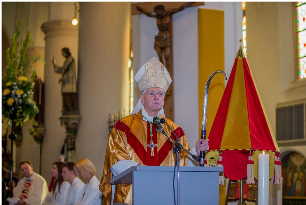
in 2011 krijgt de kerk de eretitel 'basiliek'

In 2011 is aan de Sint-Petruskerk de eretitel van basiliek toegekend door de Romeinse Congregatie voor de Goddelijke Eredienst. Daarmee werd deze kerk de 23ste basiliek in Nederland. Binnen de katholieke kerk is de titel 'basiliek' een eretitel voor bijzondere kerken. Dus vanaf die tijd is de naam Sint-PetrusBasiliek .