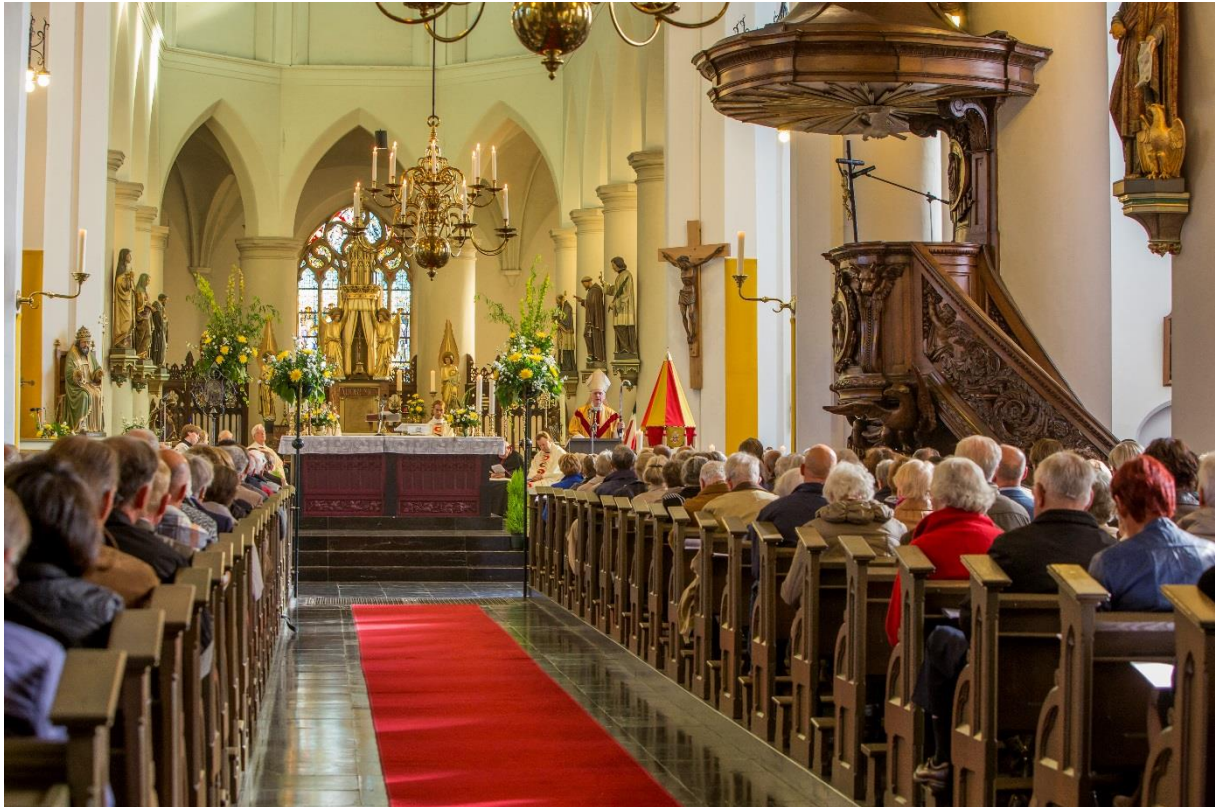
de kerk van binnen als men uit het portaal de kerk inkomt

In de jaren rond 1918 vond een grondige restauratie plaats onder leiding van architect Jos Cuypers . Toen werd aan de eerste travee van de noordelijke zijbeuk een doopkapel toegevoegd. Voordien doopte men in de sacristie.