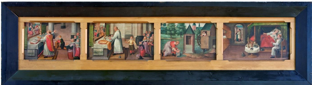
schilderij van het Bloedwonder

Rond 1380 vond in Boxtel een Bloedwonder plaats, toen de priester Eligius van den Aker tijdens de Heilige Mis de miskelk met witte wijn omstootte. Op de altaardecken ontstonden rode vlekken en de geschrokken priester probeerde tevergeefs om de vlekken uit te wassen. Vanaf die tijd kwamen grote groepen pelgrims naar Boxtel om de Bloeddoeken te vereren. Deze geliefde bestemming als pelgrimsoord heeft ongetwijfeld bijgedragen aan de bouw van een kerk van deze omvang onder andere door inkomsten uit bedevaarten.