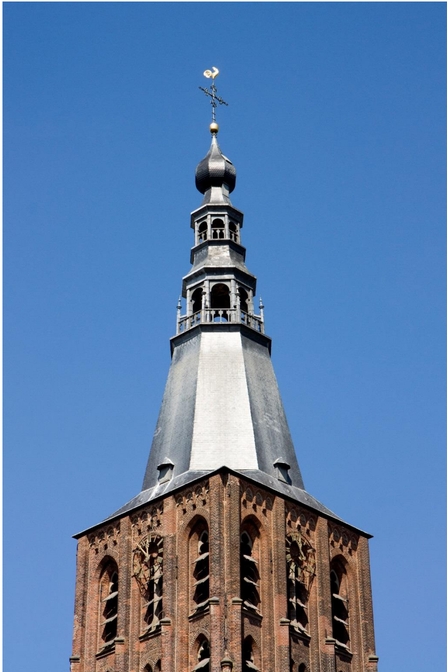
de toren in al zijn pracht

De bakstenen toren wijkt af van de gebruikelijke Kempense gotiek. Zo zijn er geen steunberen. De spits is laat-16e-eeuws en aan de zuidzijde is een portaal uit het midden van de 16e eeuw. In 1613 brandde de torenspits van de kerk af door een blikseminslag, maar deze werd twee jaar later weer opgebouwd en sindsdien is hij qua architectuur niet meer gewijzigd.