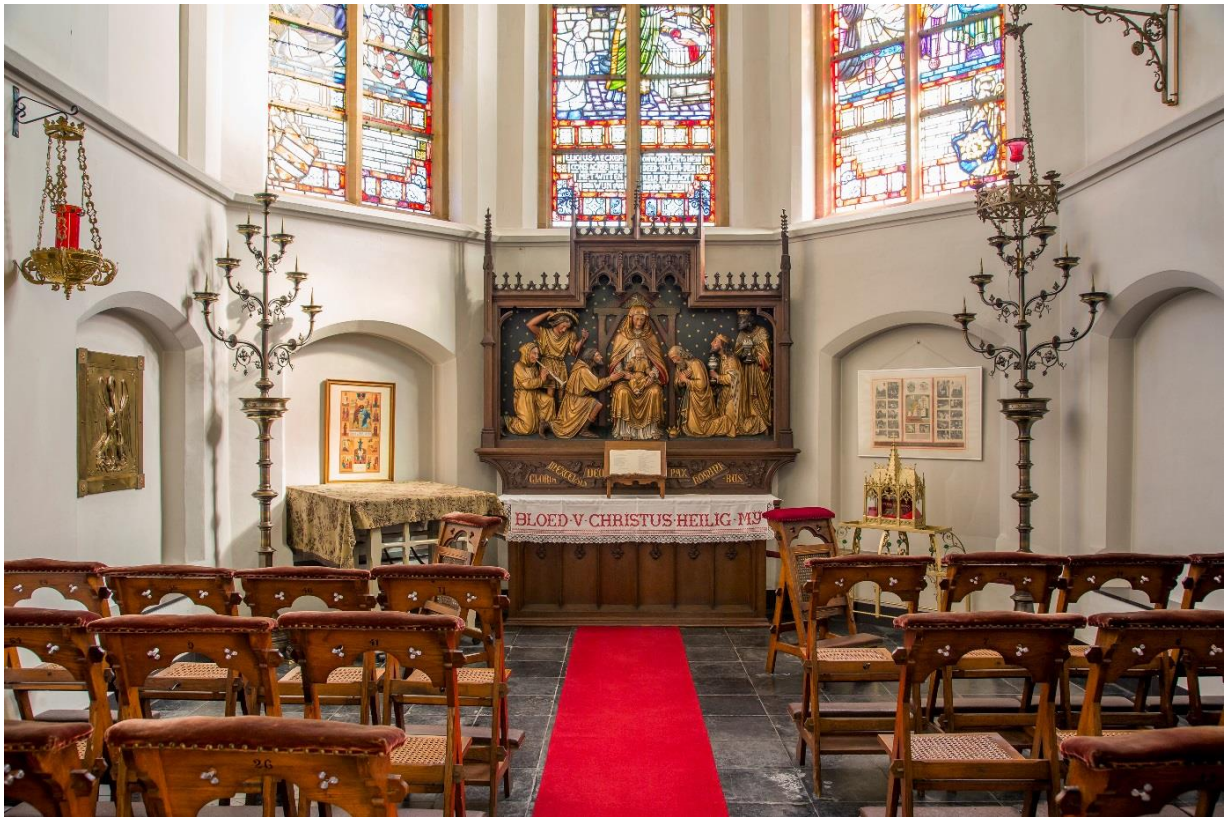
altaar gewijd aan de Drie Koningen

In de Heilig-Bloedkapel staat een altaar dat aan de Drie Koningen gewijd is.