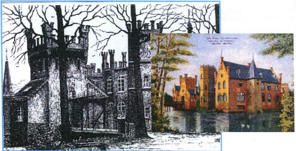
Kasteel Stapelen op oude ansichtkaarten.

→ Loop de Burgakker uit tot de kruising met de Rechterstraat.