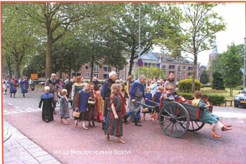
Heilig Bloedprocessie Boxtel