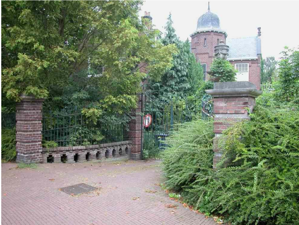
afb. 1 Entrée aan de Rechterstraat