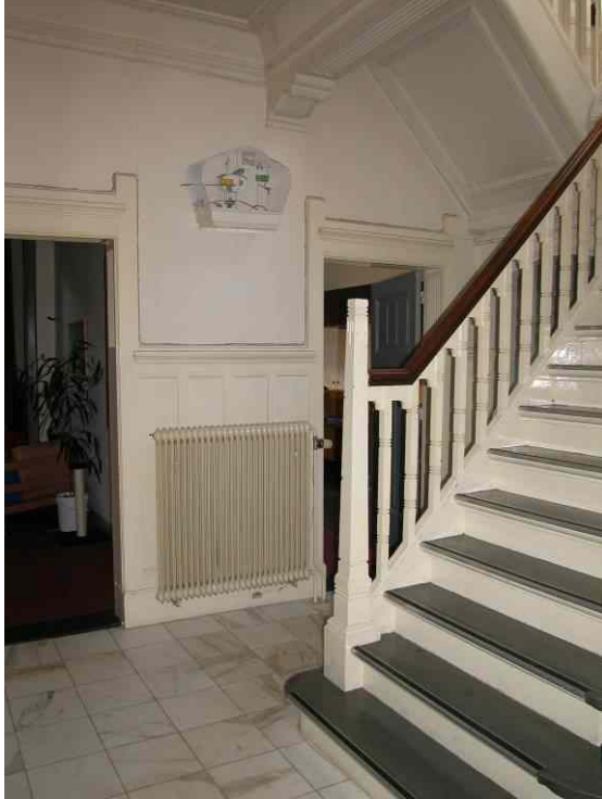
afb. 5 en afb. 6 Interieur hal met trappenhuis en stucplafond