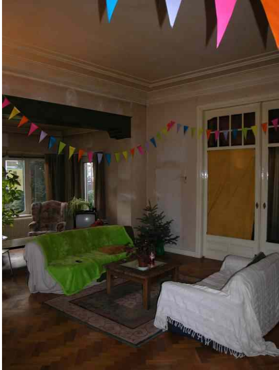
afb. 9 en afb. 10 Interieur kamer zuidzijde eerste bouwlaag