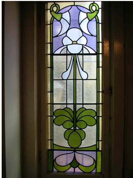
afb. 7 en afb. 8 Interieur vestibule met glas-in-loodramen