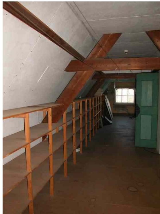
afb. 14 en afb. 15 Trappenhuis in tweede bouwlaag en detail kapconstructie