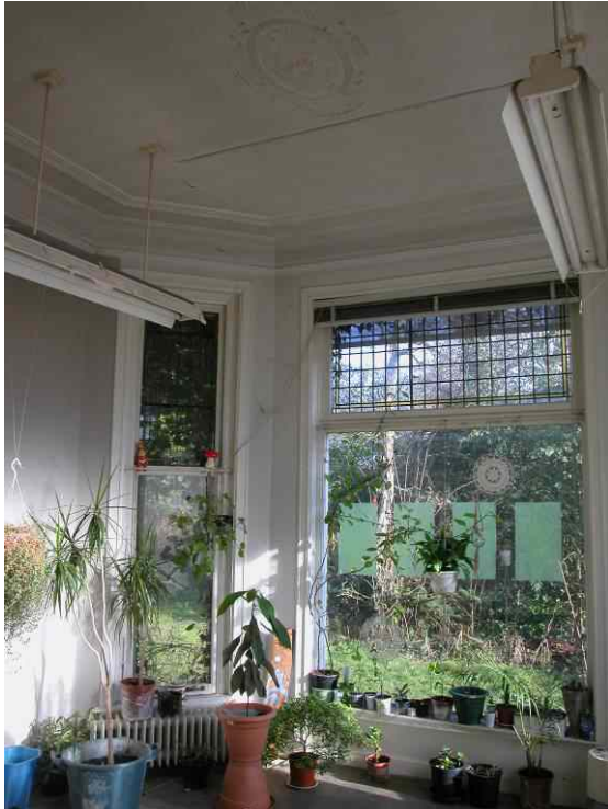
afb. 12 en afb. 13 Interieur serrekamer oostzijde, met detail glas-in-loodbovenlicht