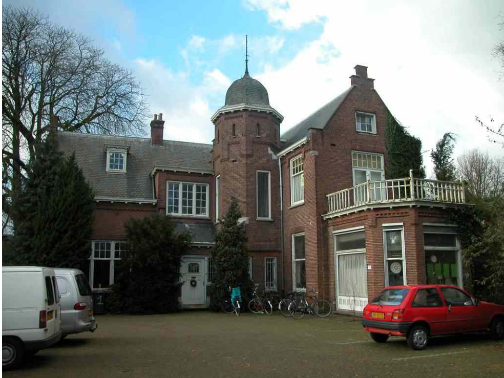
afb. 4 Oostzijde huisd