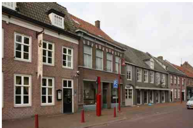
Nieuwe locatie voor lezingen van Heemkunde Boxtel. Zaal Rembrandt, Rechterstraat 56 Boxtel

Als u met de fiets komt kunt u deze het beste parkeren aan de overkant van de straat. Daar is meer ruimte.