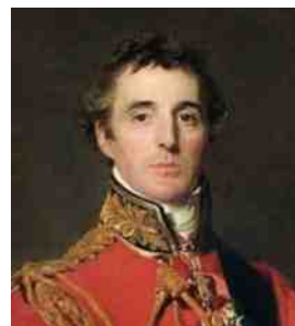
Lord Arthur Wellesley