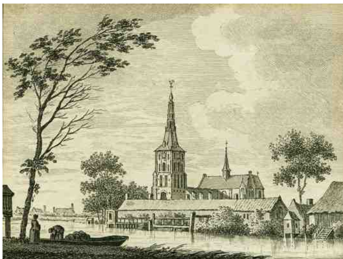
Het Clarissenklooster in Boxtel

E en kleine drie jaar geleden startte een enthousiaste werkgroep met het digitaliseren van een gedeelte van het archief van de zusters Clarissen in Megen.