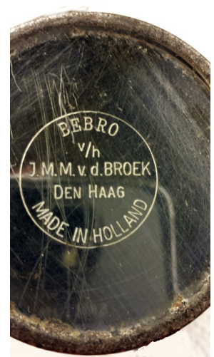
stempel na overlijden